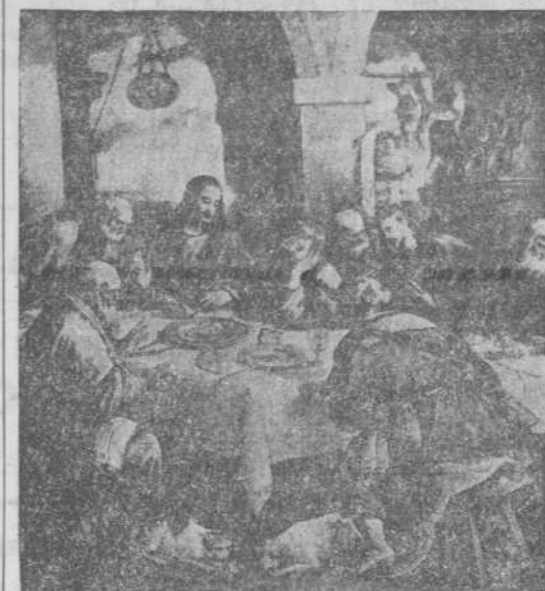
Han llegado los días grandes de la Semana Mayor.

Hoy es el gran día del amor, del perdón generoso. La Iglesia recibe el divino legado del Cuerpo y de la Sangre de Jesucristo. En la última Cena instituye el Sacramento de la Eucaristía. Con profundo recogimiento la Hostia Santa se coloca en el Monumento para que la adoremos. Este acontecimiento hace gozar a la Iglesia, que viste de blanco para la misa y toca durante el gloria las campanas jubilosamente. Pero después callan. Un silencio impresionante sucede. Se acerca la Pasión de Cristo. El beso traidor de Judas. El dolor de la despedida de Cristo en la última Cena.