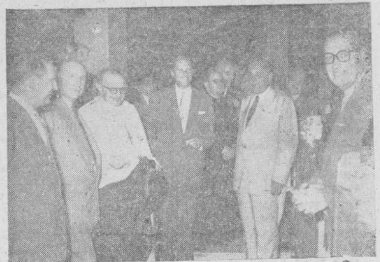
El obispo de la diócesis, con las autoridades y dirigentes de la Tómbola de Caridad al ser inaugurada ésta en la tarde de ayer.