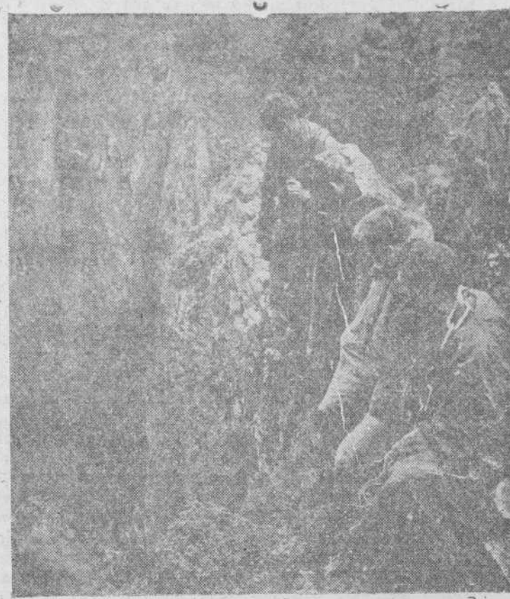
Un grupo de jóvenes "scout" contemplan interesados las profundidades de la gruta de Pierre Saint-Martin, la más honda y la más alta del mundo.