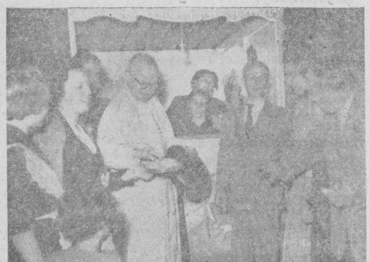
Junto a la Tómbola del Secretariado de Caridad, las reverendas madres Adoratrices han instalado un puesto de dulces, cuya venta destinan a sus Centros benéficos, y el cual fué también inaugurado con la presencia del prelado.

En días sucesivos informaremos a nuestros lectores de la organización, de los premios y de los sorteos ordinarios y extraordinarios, que han de celebrarse a lo largo de este mes de septiembre.