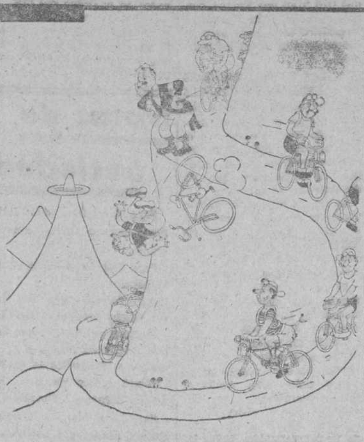
—Queda penalizado! Con esta es la segunda vez que va usted por un atajo para ganar tiempo.