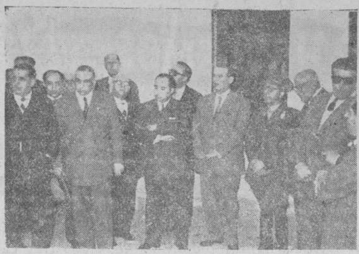
Las autoridades ante la casa del médico de Villamayor, inaugurada en la mañana de ayer.