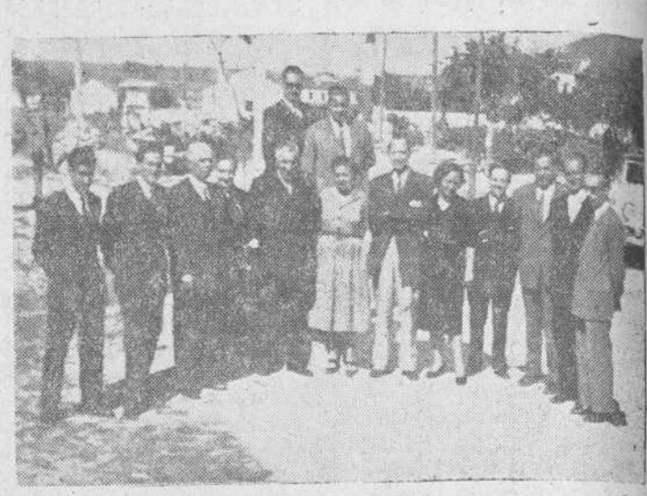
Los administradores de las Aduanas de Villar Formoso y Fuentes de Oñoro, con los miembros de la Sociedad Amigos de Portugal y personal facultativo de la Aduana española

Varios miembros de la Directiva se trasladaron el domingo con aquel objeto a la frontera