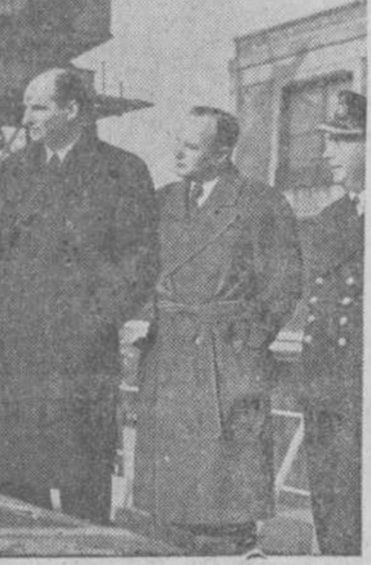
El ministro británico de Alimentación, Mr. John Strachey, a la izquierda, presenciando la descarga, en el puerto de Londres, del primer envío de azúcar a cargo de la Ayuda a Marshall