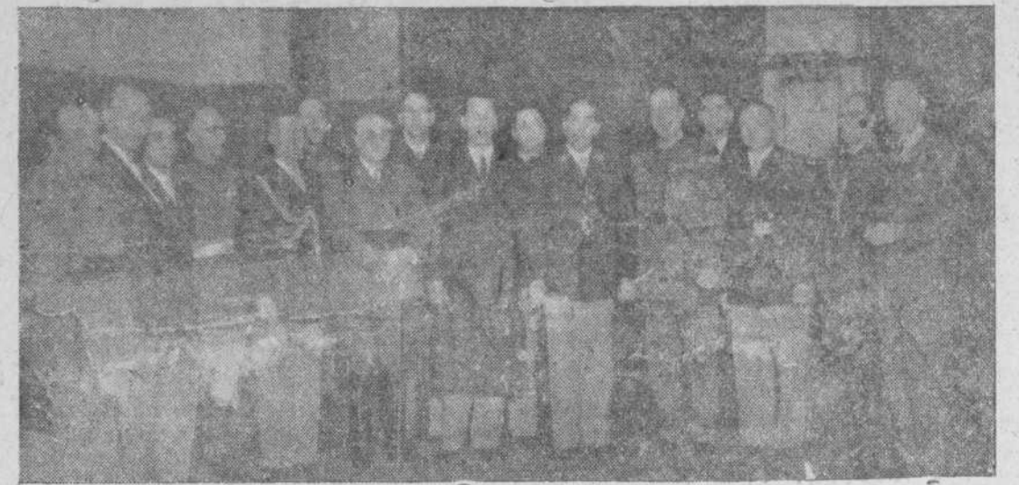
La Misión Militar Argentina, que preside en general Avalos, acompañada por el embajador de la Argentina, don Pedro Radío, durante la visita que hicieron a la Academia General Militar donde hubo una recepción efusiva y patriótica.