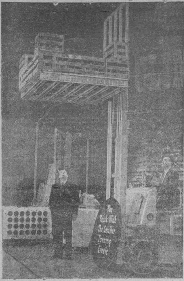
Camión adaptado para la carga y elevación de mercancías, exhibido en la Exposición de Londres