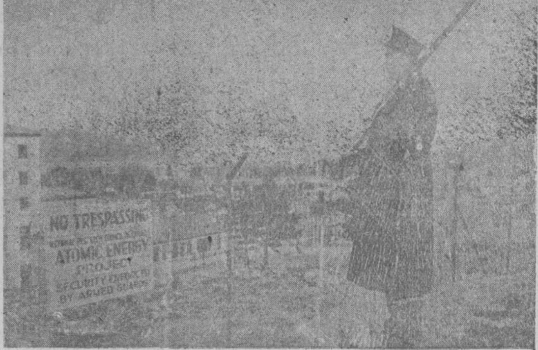
Chalk River (Ontario, Canadá). - El Consejo Nacional Canadiense de Investigación, que posee aquí una instalación de veinte millones de dólares, para explorar, en física, química y biología, la energía atómica, ha colocado en las abantracas que cercan las obras