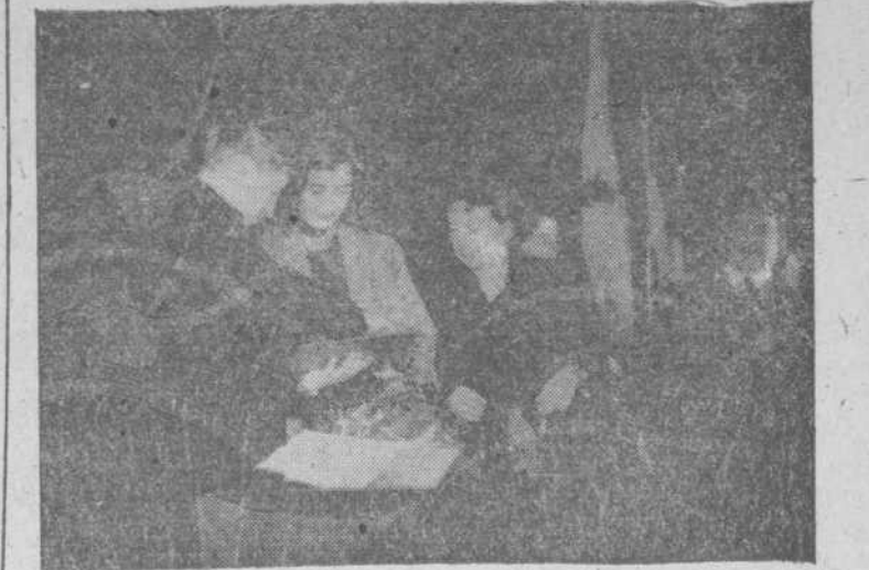
La delegada nacional de la Sección Femenina, Pilar Primo de Rivera, en el acto de hacer entrega a la señorita María del Carmen Franco al certificado de haber cumplido el Servicio Social.