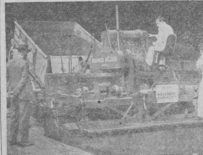
Esta máquina que se utilizó para construir aeródromos durante la guerra, se emplea ahora para hacer calzadas. Es arcaica el faltarle de manera uniforme y una densidad igual en cualquier sea a desigualdad del suelo. A medida que avanza deja la calzada ya terminada.