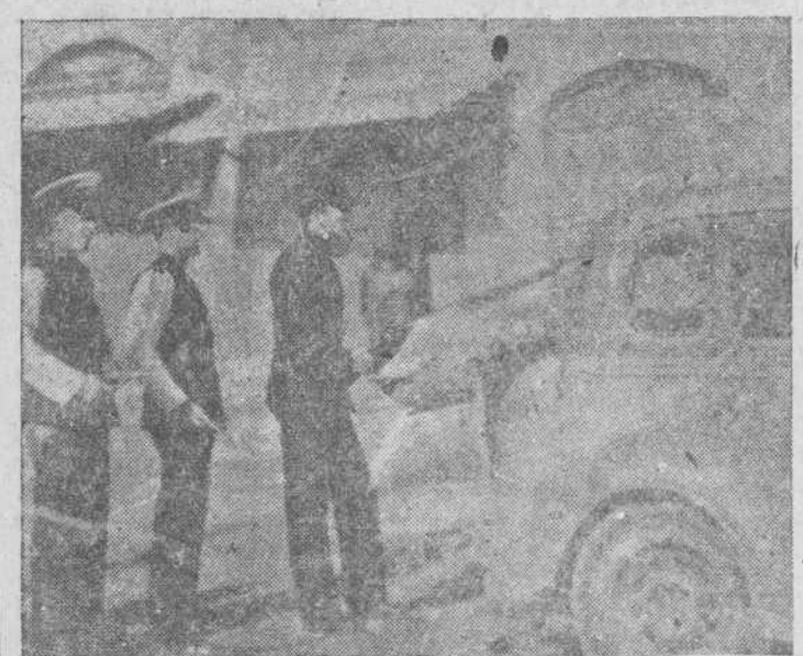
Jerusalén.—Mientras los ocupantes de un (autobús) rociaban de bombas a la muchedumbre, los de un «taxi» descargaban sobre el mercado de esta ciudad una bomba que producía la muerte a tres árabes y un policía británico. En la fotografía, la Policía británica del tráfico, que se encontraba en el mercado, se protege detrás de un coche en el momento de la explosión de la bomba.

Jerusalén.—Los árabes acusan al Gobierno de Palestina de ser culpables de la explosión del Hotel Seminario; por no haber adoptado las medidas adecuadas de seguridad. Los judíos siguen afirmando que era el Cuartel General