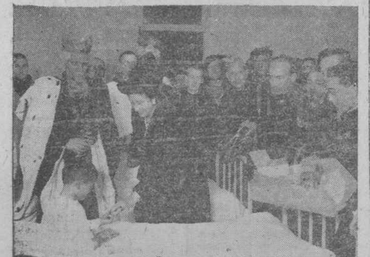
La esposa del Caudillo, excelentísima señora doña Carmen Polo de Franco ha asistido a la gran fiesta de Reyes Magos, organizada por Radio Nacional de España, durante la que se ha hecho entrega de juguetes y dulces a los niños asistidos de este asilo, que con tanto amor cristiano dirigen los HH. de San Juan de Dios.