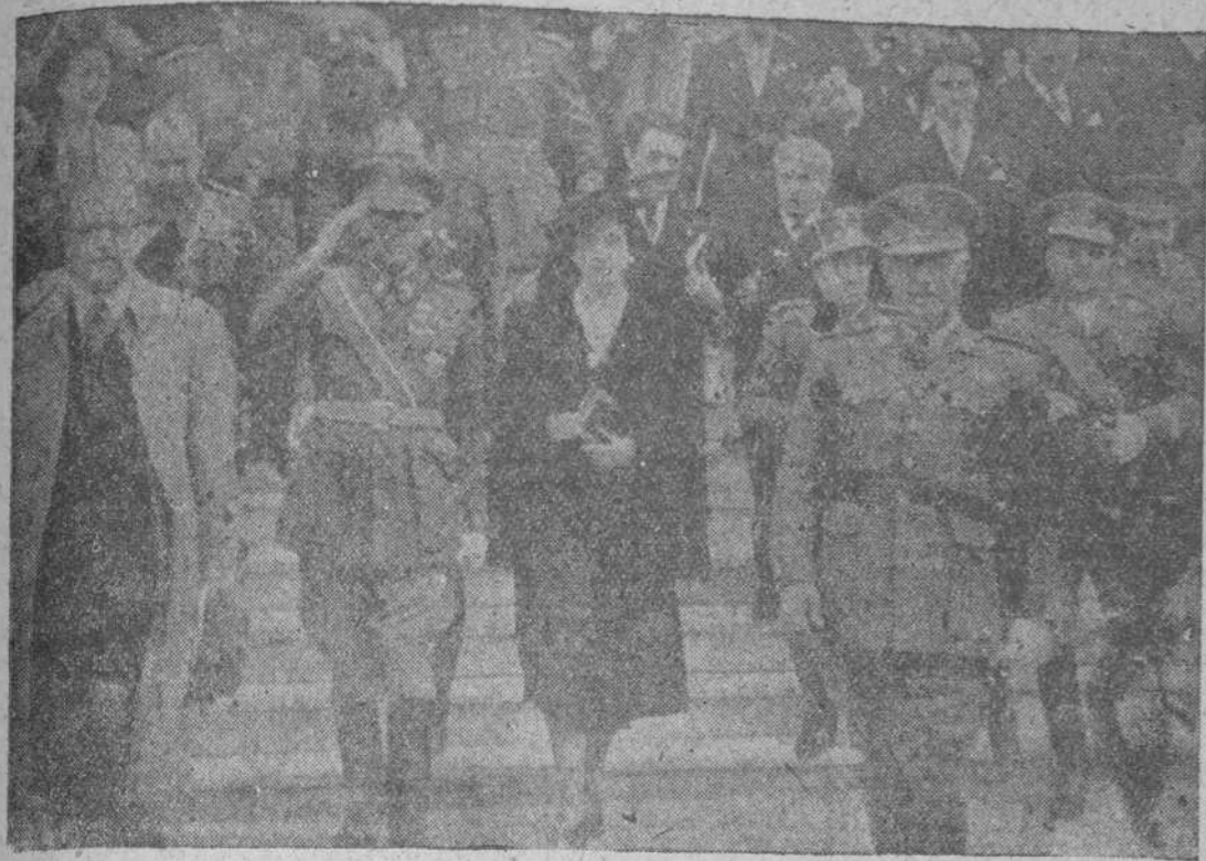
Presidida por el Generalísimo Franco, se verificó la inauguración del bienal castrense artístico que se celebra en los palacios del Retiro. En nuestra fotografía, el Caudillo, con doña Carmen Polo de Franco y su séquito, sale de la sección de pintura para dirigirse al Palacio de Cristal, donde está instalada la Exposición de esculturas.