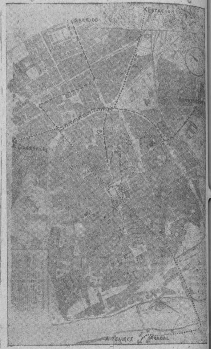
En este croquis, trazado sobre un plano de Salamanca, puede lector darse cuenta de la amplitud que tendrán las futuras líneas de autobuses salmantinos. Casi todos los trayectos, a excepción de los que pasan por la calle de José Antonio y otros cruces, de poca importancia, se resuelven entre el plazo con líneas de puntos y trayectos, y las paradas con apeos en los términos de viaje.