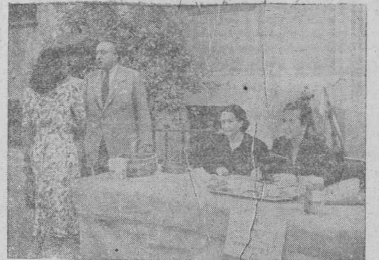
Mesa instalada ante el Banco de España, durante la colecta de ayer a favor del Patronato Antituberculoso

Tanto en las mesas petitorias, como la postulación, dieron un ingreso verdaderamente magnífico