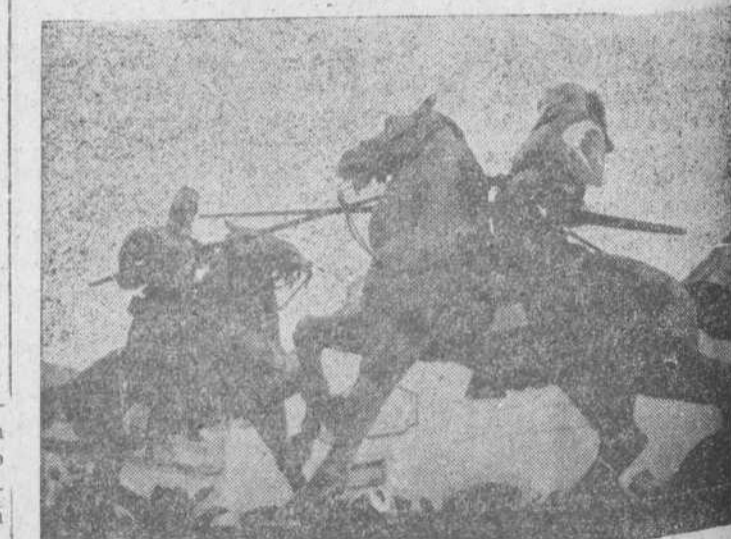
"Don Quijote y el Caballero de la Blanca Luna", carroza que figuró en el cortejo de anoche, en homenaje a Cervantes

En honor del ministro de Asuntos Exteriores San Sebastián.—El embajador de Portugal ha obsequiado, a media de hoy, con un almuerzo, al ministro de Asuntos Exteriores, señor Martín Artajo. Asistieron, además, el instructor de Embajadores, señor barón de las Torres, autoridades de la provincia y otras personalidades. (Logos.)