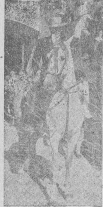
El duque de Pinohernoso preparado para hacer el paseo

A media corrida se procedió al sorteo del "Toro de Oro". Corresponsal al ocupante de la localidad número 119 de la tercera fila de grada de sol, que era don Vicente Quintano Cornejo. Como es ya tradicional, el agraciado se decidió por los mil duros. ¡Que aprovechen!