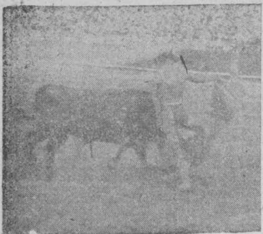
Un buen lance de Belmonteño

Belmonteño puso un poco de calma en una tempestad desencadenada de protestas