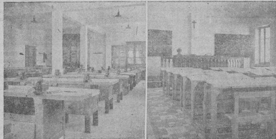
Taller de ajuste mecánico, y una de las aulas

La Escuela de Peritos Industriales y la Elemental de Trabajo, pretenden serlo, en Béjar; el lograrlo es ya obra de todos.