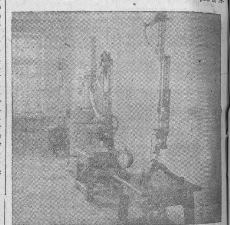
Aula de Física

con tres laboratorios, dos de ellos dedicados a la química, de vital importancia para la industria característica de la población. El taller mecánico permitirá la construcción de maquinaria a la vez que prestar cualquier clase de auxilio a la industria local. Otro de los aspectos interesantes que ofrece la Escuela, es el de su gran salón de actos, con decoradas estancias, butacas, sillas y severamente decorado, mientras también está proyectado un laboratorio fotográfico para la re-