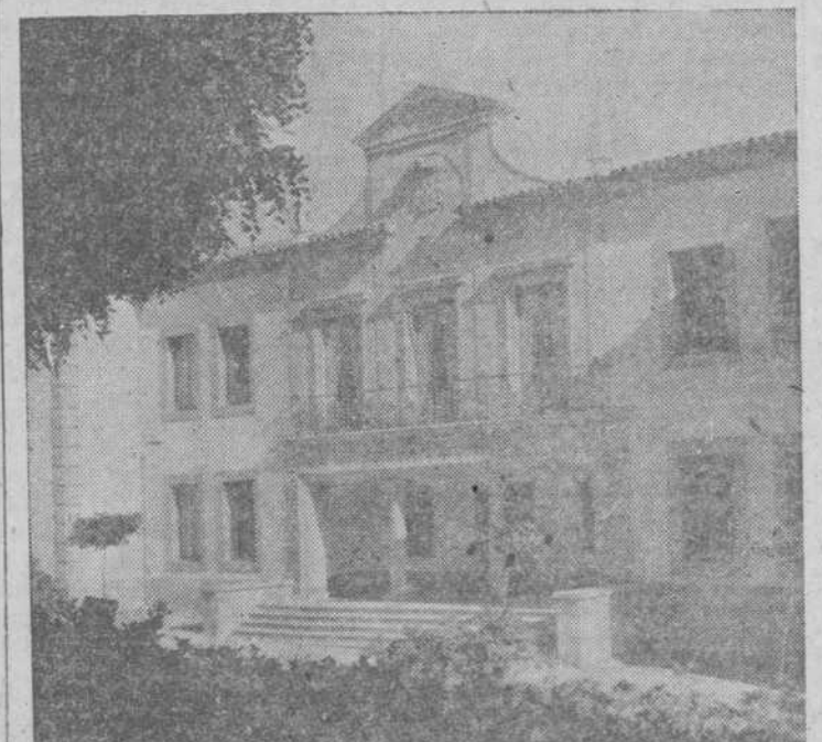
Fachada principal, frente al parque de «La Corredera»

(Vea nuestros reportajes de última página)