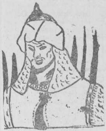
"Al-Om", por Manuel García Escobas

Saluda y pone a disposición de sus numerosas amistades y público en general, su establecimiento de Ultramarinos Finos POZO AMARILLO, 20 APERTURA: LUNES, 16