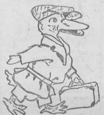
"El pato aventurero", por Juan de la Fuente