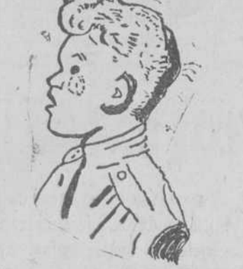
"Oto", por Manuel García Flores, de Alba de Tormes.