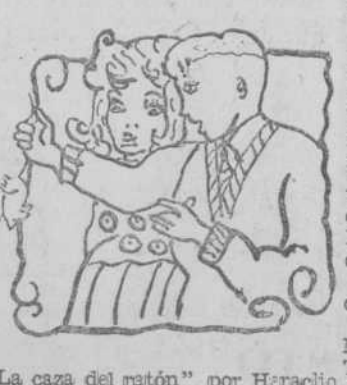
"La caza del patón", por Heracleo García, de Fuente de San Esteban para gastos de franquero.