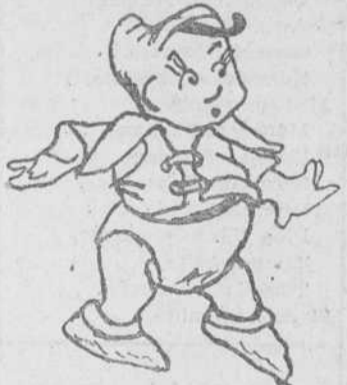
"Pulgarcito", por Rosalía Hernández