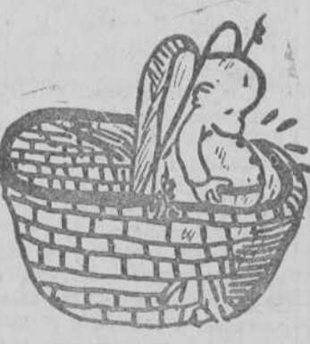
"Pepote", por Rafael Ríos