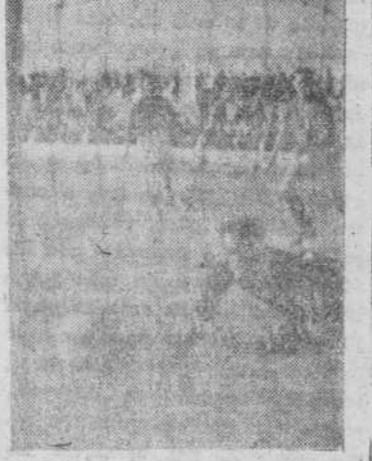
Este fue el primer gol de la tarde, a favor de la U. D. S.—E de Melilla, contrapunto, con rabia e ímpetu, al ver que no puede alcanzarlo.

defensas débiles y medrosas y estériles ante potentes zigueros. Los ses tantos del domingo, buscados con ahínco, repartidos entre los encuentros que nos han