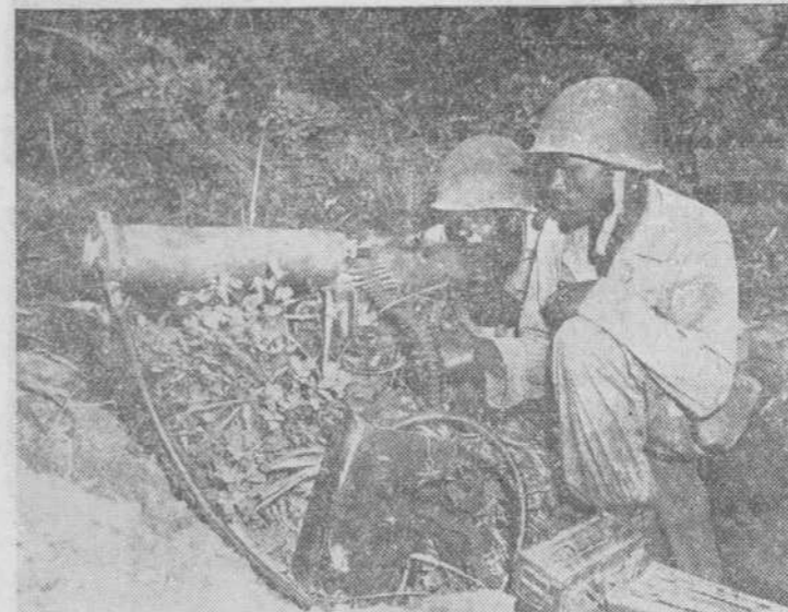
Los soldados norteamericanos con una ametralladora hidrorrefrigerada, en el frente de Corea

La aviación de la Marina norteamericana bombardeó las concentraciones de fuerzas comunistas cerca de la frontera con Manchuria.