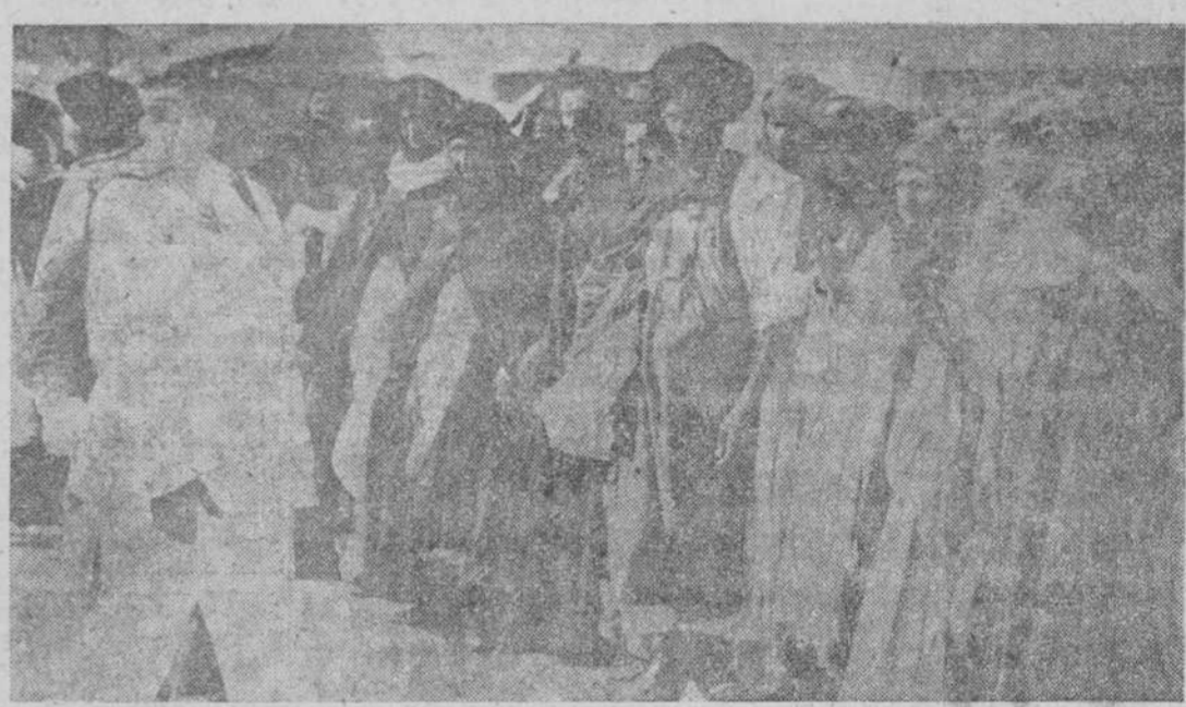
Los nobles «saharauis» de nuestras posesiones del Africa Occidental contemplan, con admiración y cariño, al Jefe del Estado español

IMPORTANCIA DE LAS OBRAS PUBLICAS CANARIAS. Santa Cruz de Tenerife.— A 200 millones de pesetas alcanza el presupuesto de las obras públicas que se realizan en esta población y algunas de las cuales han sido visitadas por el Caudillo. Se está terminando el dique muelle del Este por un importe de 38 millones. Están ya muy avanzadas las obras del dique muelle del Sur, cuyas obras dieron comienzo hace dos años, con un presupuesto de 50 millones de pesetas y también están concluyéndose las obras del muelle de la Ribera, destinadas al tráfico interinsulares e importantes en ocho millones.