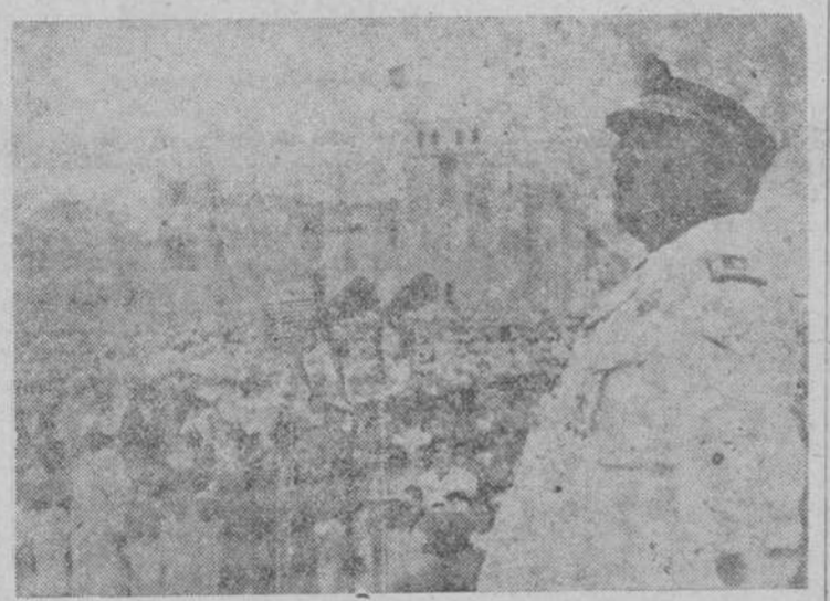
El Caudillo dirigiendo la palabra a los indigenas congregados en la plaza de Sidi-Ibni.