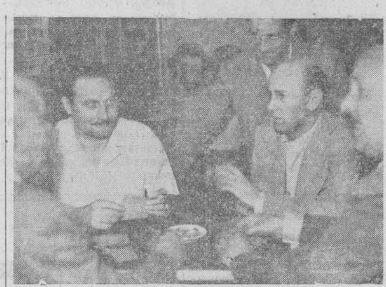
Una mesa de mus verdaderamente expresiva

verificándose la recaudación de dicho por jugador y día, terminará con la comida fraternal que celebrarán ambos equipos, convidando los ganadores a los derrotados, para suavizar el amargor de tal derrota, y cuya fiesta final será organizada —esa es la prerrogativa de triunfador— por la Peña ganadora de la contienda, a cuyas elecciones y menú —de seis platos y orden a la grande— se someterán complacidos los derrotados, dispuestos siempre a la revancha, que en dominó y en mus no hay derrotado que no siga jactándose de ser campeón malogrado por la mala suerte de un día.