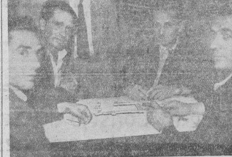
Una de las patidas de dominó

Hasta el 15 de septiembre se admiten inscripciones en primera y segunda enseñanza