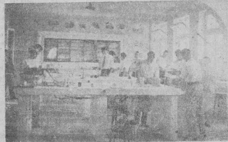
Los cursillistas practicando en un laboratorio

Las magníficas condiciones de la ciudad de Béjar, como estación veraniega, y el entusiasmo e interés que los bejaranos han demostrado por acoger dignamente a nuestra Universidad, son circunstancias que no pueden ni deben olvidarse y que fuerzan a que estos cursos sean un principio y no un fin en las iniciativas universitarias.