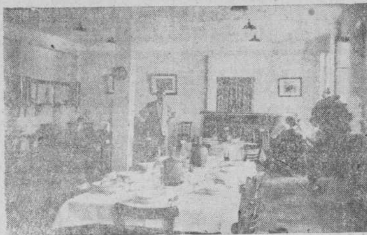
Una de las aulas habilitada para comedor de los internos

La segunda parte, de carácter general, se dedicaría a cuantas personas desearan asistir a ellas y versarían sobre temas de general interés, tales como arte, literatura, filosofía.