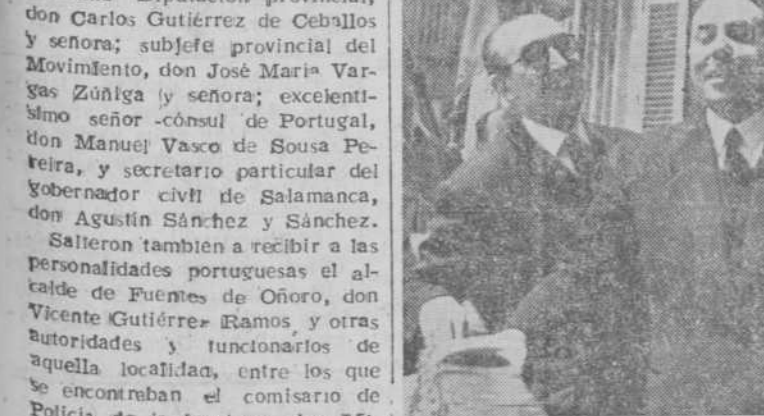
El gobernador civil de Guarda, el de Salamanca, el alcalde de la ciudad y el cónsul de Portugal, en el balcón del Ayuntamiento

A la una de la tarde salieron del Gran Hotel las autoridades