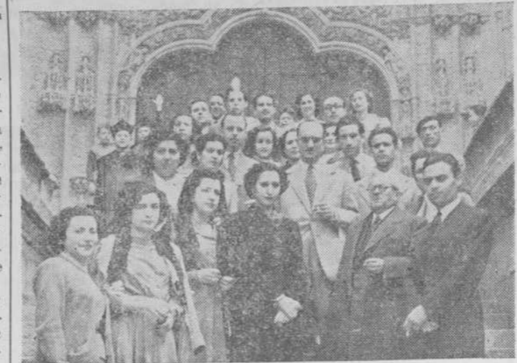
Los excursionistas madrileños durante su visita a la Catedral salmantina