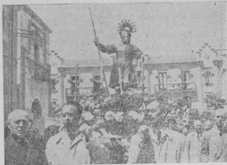
La imagen de San Isidro, durante la procesion celebrada ayer en la Plaza de los Bandos

Fue organizada por la Cámara Oficial Sindical Agraria, la Sección Agronómica y la Unión Territorial de Cooperativas del Campo