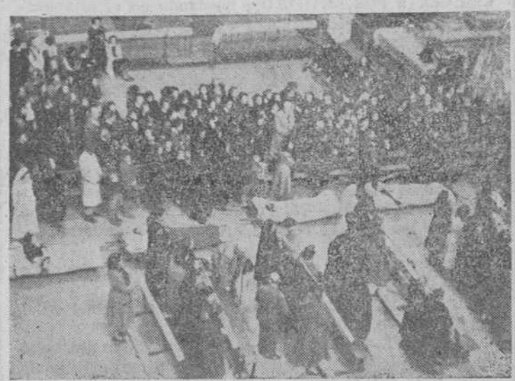
Un aspecto del templo de San Esteban, en el lugar acotado para los enfermos e invalidos, que, en camillas, recibieron la bendición.

Misa de comunión general por el excelentísimo señor obispo y bendición para los enfermos