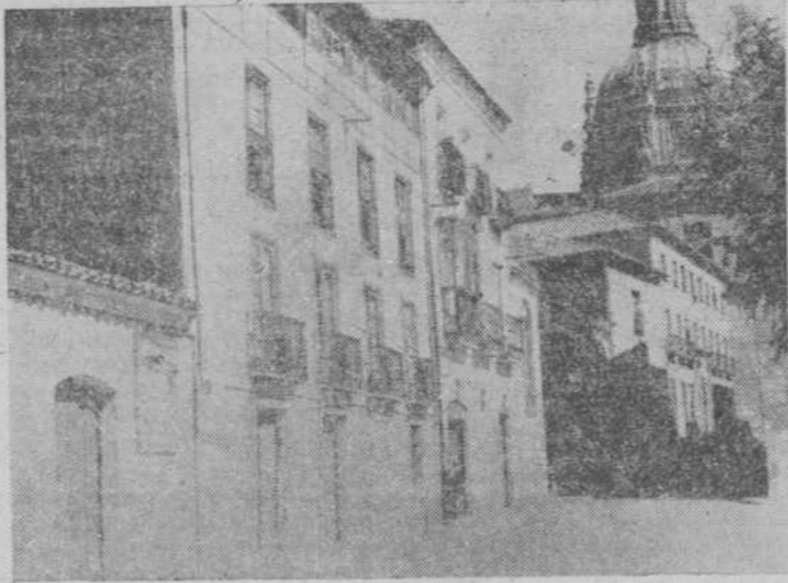
Cinco meses hará que se hizo esta fotografía, y todas las viejas edificaciones han desaparecido para comenzar la construcción de la nueva Facultad de Derecho