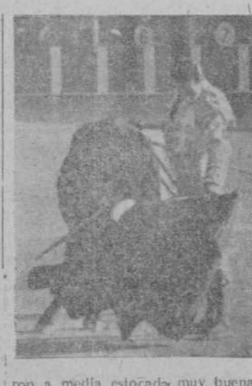
ron a media estocada muy buena, recetada al hilo de las tablas. Si cogie la muerte a los toros, lucirá mucho, porque su toro es fino y de buena ley. Adelante, pues.