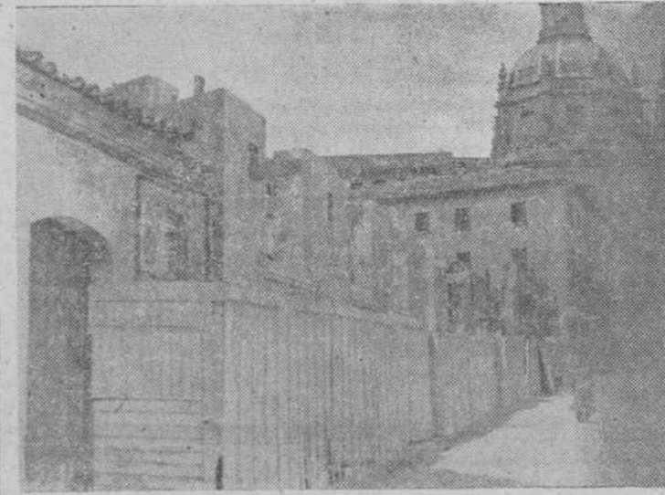
Aspecto actual de las obras de ampliación de la Universidad, que a gran ritmo va levantándose en la Plaza de Anaya