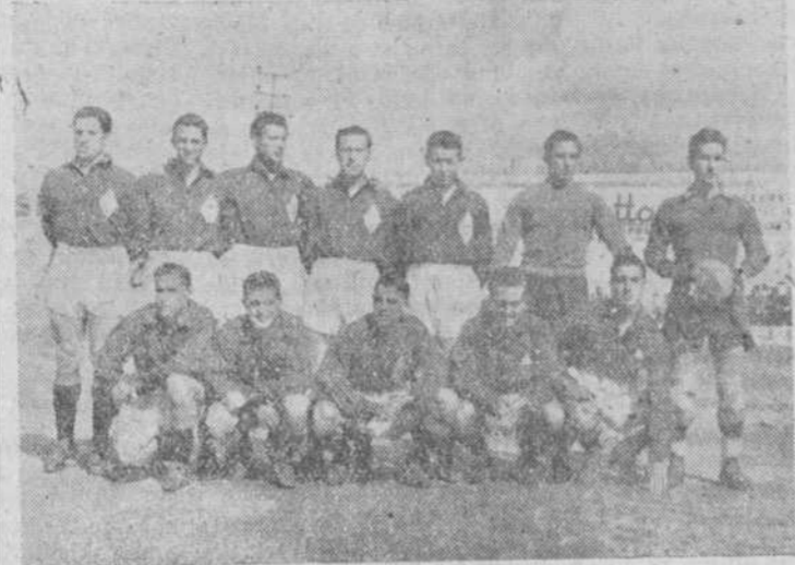
La Selección de Castilla

Conforme se había anunciado, ayer tarde, en El Calvario, y ante regular concurrencia, se jugó el encuentro Selección de Castilla - Ciosev, que terminó con el resultado indicado.