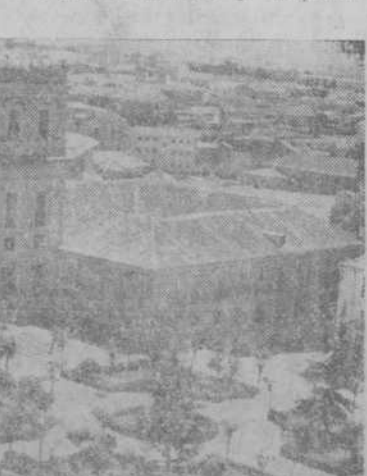
Uno de los más bellos aspectos de la Plaza de Anaya y del Palacio en que actualmente se encuentra la Facultad de Ciencias.

El edificio se construirá en piedra granítica almohadada en sus cimientos, hasta la altura de la primera planta, y el resto, de la famosa piedra de Villamayor, que tanta presencia da a la ciudad. Si distribución interior, haré de la ya indicada, será: Once laboratorios de treinta metros de largo cada uno para alumnos. Un laboratorio y despacho