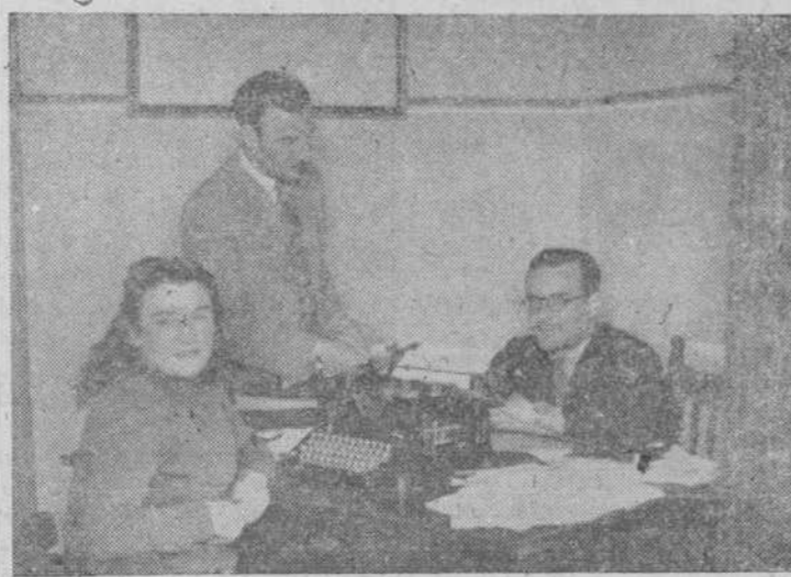
El personal del Sindicato de Cereales, de Salamanca, cuando nos preparaba los datos estadísticos...