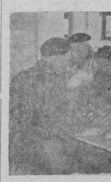
En el interior se procede al lavado de los menudos de los animales.

Después, recorrimos todas las dependencias: las naves donde se sacrifica el ganado mayor, las corralizas, bien protegidas