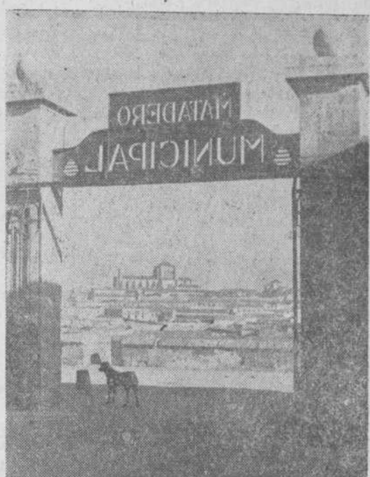
Una perspectiva salmantina desde el interior del Matadero Municipal

Ni la conducción del animal al tajo ni el chamuscado imperfecto y desigual, ni el resto de las operaciones, nada de la rapidez, limpieza y diligencia nuevas por el personal encargado de todo ello, se asemejaban a aquellos corralillos de Guisasa, en que el cerdo era muerto más rápidamente y placidamente, a aquellas mesas de descuartizamiento, a aquellas calderas y a aquellos hornos de chamuscado, rápidos y per-