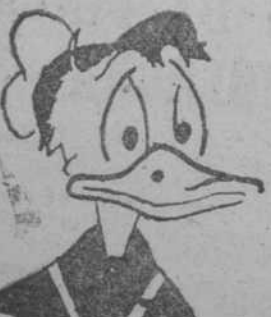
El Pató Donald, por Isidrin González Martín, de Rollán.