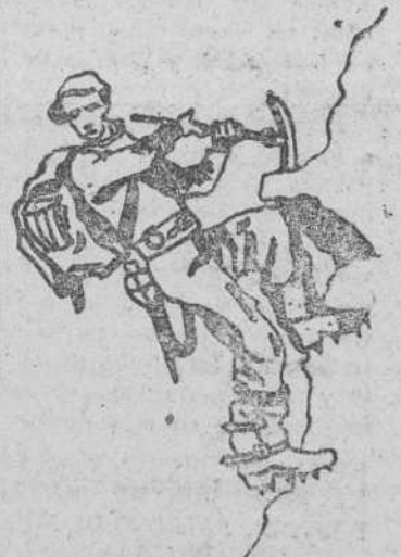
Alpinista, por Mariano Merchán.