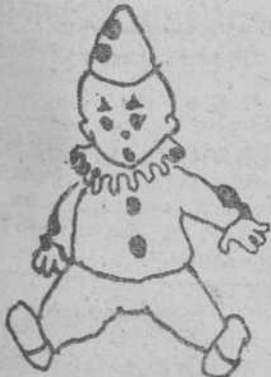
Un payasito, por José-Delfin Val.

El Ayuntamiento madrileño ha acordado erigir un monumento a don Jacinto Benavente. El alcalde manifestó que el monumento existente en la plaza que lleva su nombre y que representa la figura de Chopin, de "Los intereses creados", será colocado en el Parque del Retiro.