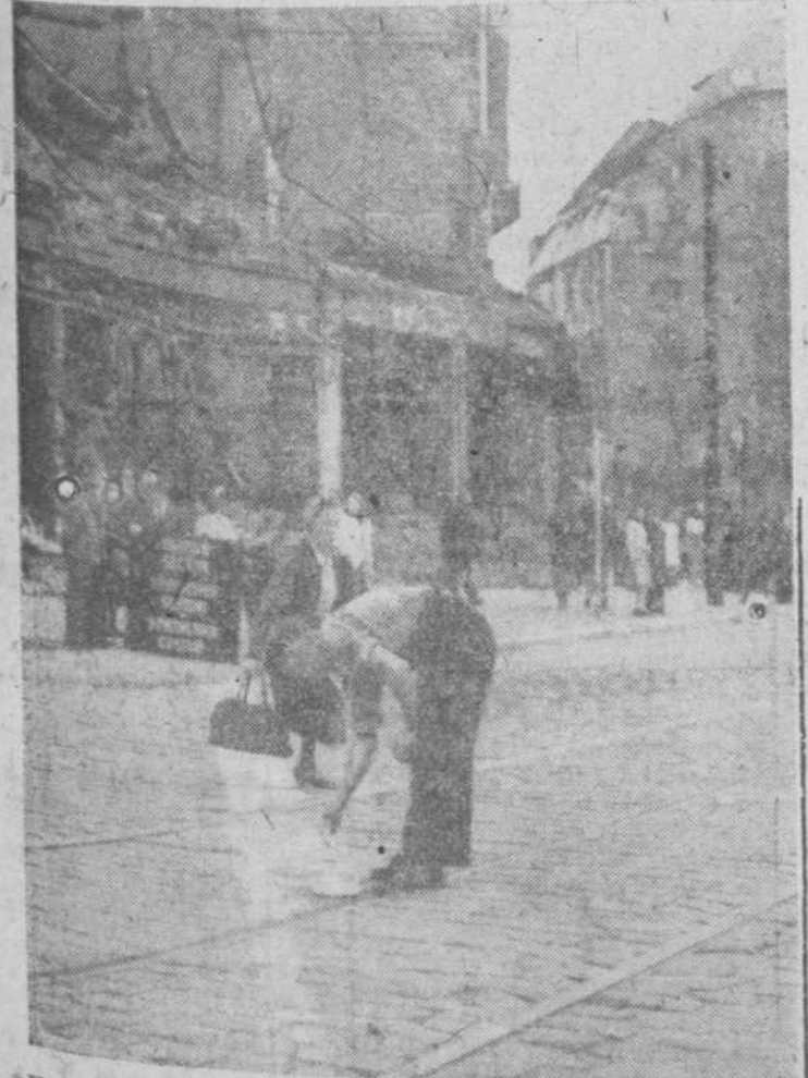
Un funcionario británico pinta la línea fronteriza que separa las zonas rusa y británica en la capital berlinesa.