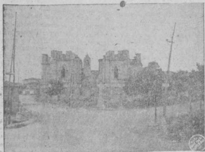
Vista de la fachada principal de la Basílica, en su estado actual.

Pero de entre todos esos acontecimientos, hemos de registrar aquel en que el pueblo albeno "se amotinó". Fué en el año de 1914, con ocasión de celebrarse el tercer centenario de la beatificación. El general de la Orden carmelitana, quiere ver el cuerpo de la Santa. El pueblo interpreta que se van a llevar tan preciada reliquia y se origina una tumultuosa protesta, tal, que el día 28 de agosto, se vieron precisadas las autoridades a salir precipitadamente en