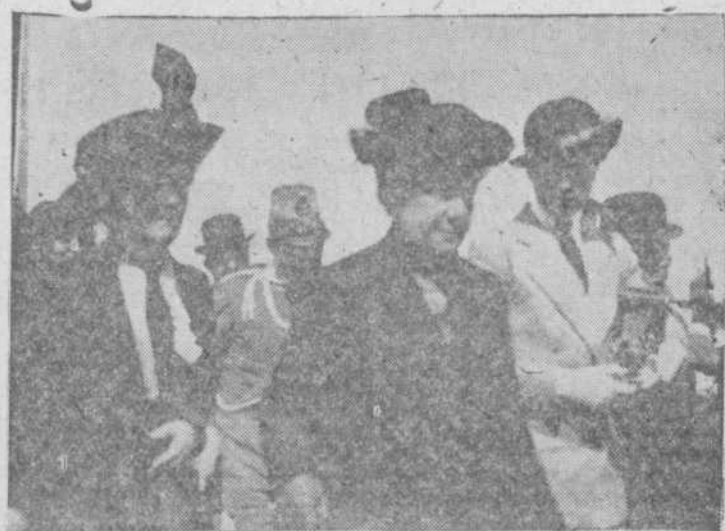
La infanta doña Paz de Borbón y la princesa Pilar de Baviera, entrando en Alba de Tormes, acompañadas de las autoridades de Salamanca y Alba, en mayo de 1914.

Hay que reconocer que Alba de Tormes, respira únicamente por la influencia de la vida y la muerte de Santa Teresa de Jesús. La madre Teresa sintió predilección por su palmarcito albeno, y aunque es cierto que llevó en sus sandalias polvo de muchos caminos, no se admite la idea de que todas las tierras le fueran iguales. Hay dos lugares que se repartieron el cariño de la Santa: Avila y Alba de Tormes. La primera, lugar de su nacimiento, de su profesión religiosa en el Convento de la Encarnación, allí donde se despertaron sus ansias de acercarse a Dios y donde tuvo la inspiración divina de las fundaciones. Don Miguel de Unamuno, en su "paisaje teresiano", dice que el "Castillo interior de las Moradas", es la ciudad de Avila, con sus murallas y los cubos de éstas. Ello parece expresar que Teresa de Jesús, sintió sus obras y más particularmente "Las Moradas", precisamente en ese castillo interior, en la ciudad que "tiene que mirar constantemente al cielo".