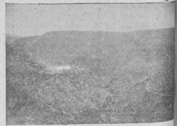
Un aspecto de la Sierra de Valero.

Este último es particularmente interesante, y de él nos ocuparemos otro día.