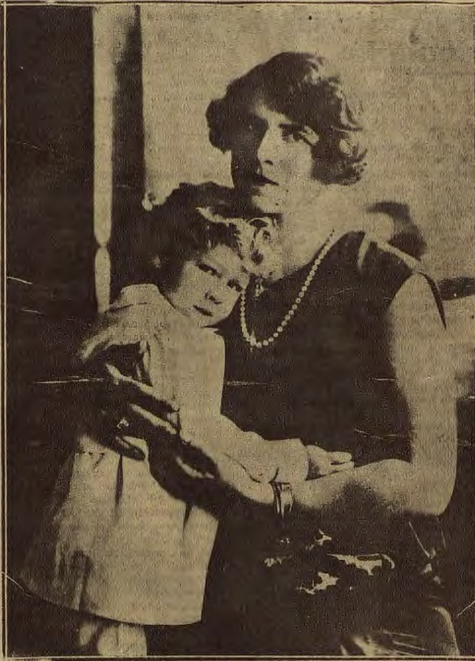
LA PRINCESA HELENA, DE GRECIA, CON SU HIJO EL PRINCIPE MICHEL, QUE HA SIDO DECLARADO HEREDERO DEL TRONO DE RUMANIA POR RENUNCIA DE SU PADRE EL PRINCIPE CAROL