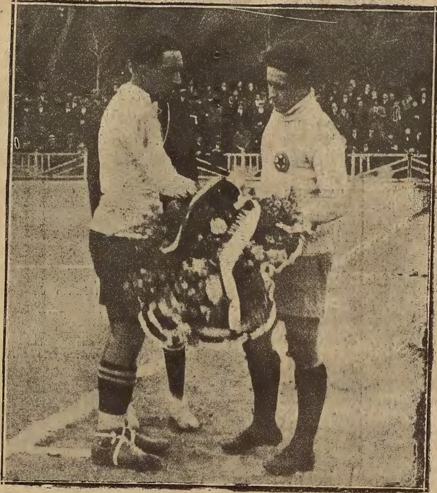
DEL PARTIDO DE FUTBOL DE ANTEAYER.—LOS CAPITANES DEL SPARTA, DE PRAGA, Y DEL REAL ZARAGOZA C. D., CAMBIANDO LOS RAMOS ANTES DE COMENZAR EL PARTIDO