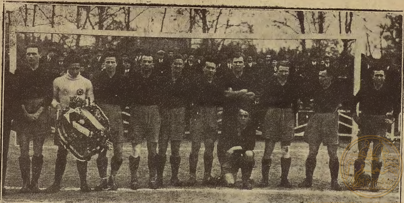
DEL PARTIDO DE FUTBOL DEL DOMINGO.—EL EQUIPO SPARTA, DE PRAGA, QUE VENCIO AL REAL ZARAGOZA C. D., POR SEIS A UNO