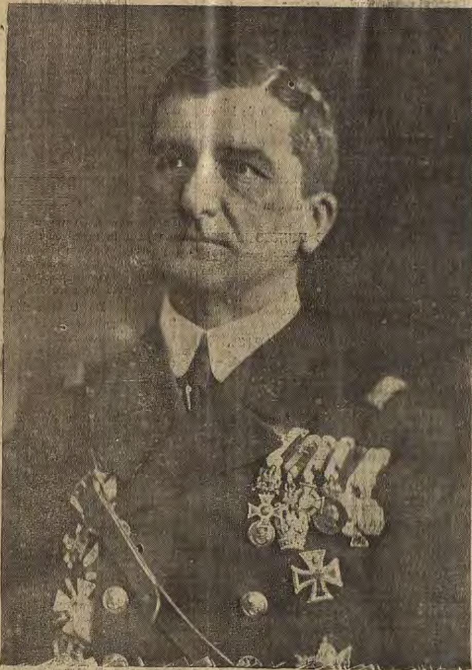
FIGURA DE ACTUALIDAD.—El Regente de Hungría, amirante Horthy, contra el cual están realizando una campaña sus enemigos políticos

En todos los modelos que en el folleto se presentan se huye de lo costoso y monumental; procurando sujetarse a las necesidades de cada pueblo y la posibilidad económica de cada Ayuntamiento.