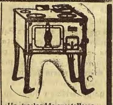
Ha trasladado sus talleres, por ampliación de negocio a la calle Mayor, núm. 61.

de todos los tamaños y diferentes modelos para carbón y leña, con depósito de hierro fundido esmalado, cocinas para serrín, termosifones, etc.