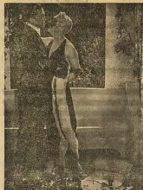
Una escena de este interesante vodevil francés al estilo de «Su Majestad el Amor»

S. A. G. E. EL LOCAL DE LOS INCOMPARABLES ESPECTACULOS