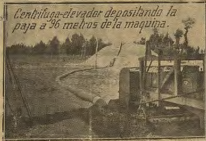
Centrifuga-elevador depositando la paja a 96 metros de la máquina.