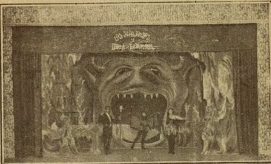
Los «JUALANSOS», que debutan hoy en el Teatro Principal