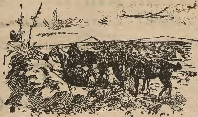
Soldados de caballería observando desde un recodo los movimientos del enemigo.

Han vuelto a presentarse ante el general Cabanellas varios jefes de las cabillas de Beni-Uqull y Ujal-Setut, reiterando sus ofrecimientos de sumisión sin condiciones, hallándose dispuestos a entregar armas, municiones, caballos y los rehenes que sean precisos.