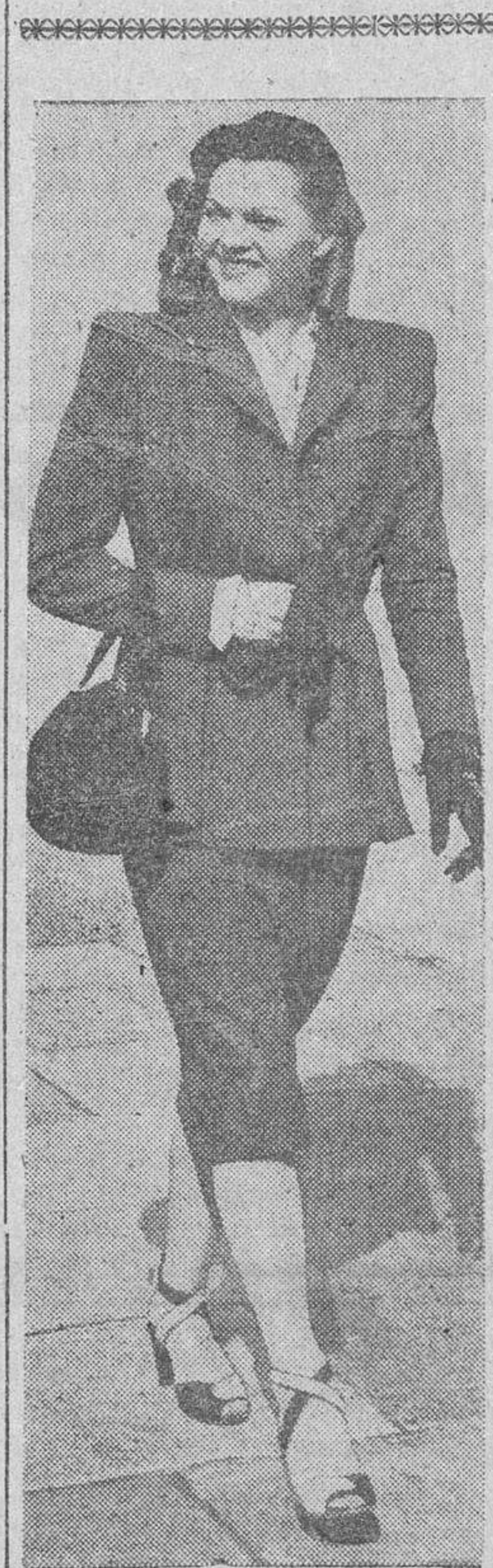
Elegante modelo en color azul indigo y sombrero de terciopelo negro