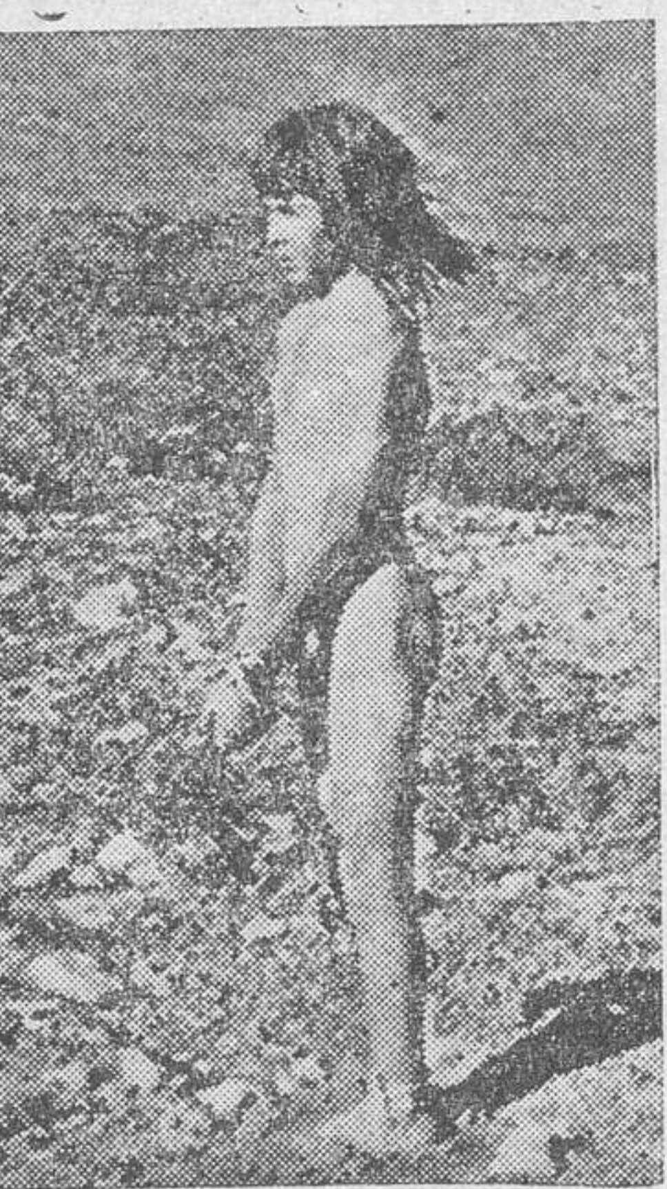
He aquí el moderno Tarzán, capturado por una expedición inglesa en el desierto de Siria. Como se sabe, el muchacho se ha criado entre una manada de gacelas, y de ellas ha adquirido, sobre todo, una velocidad sorprendente.