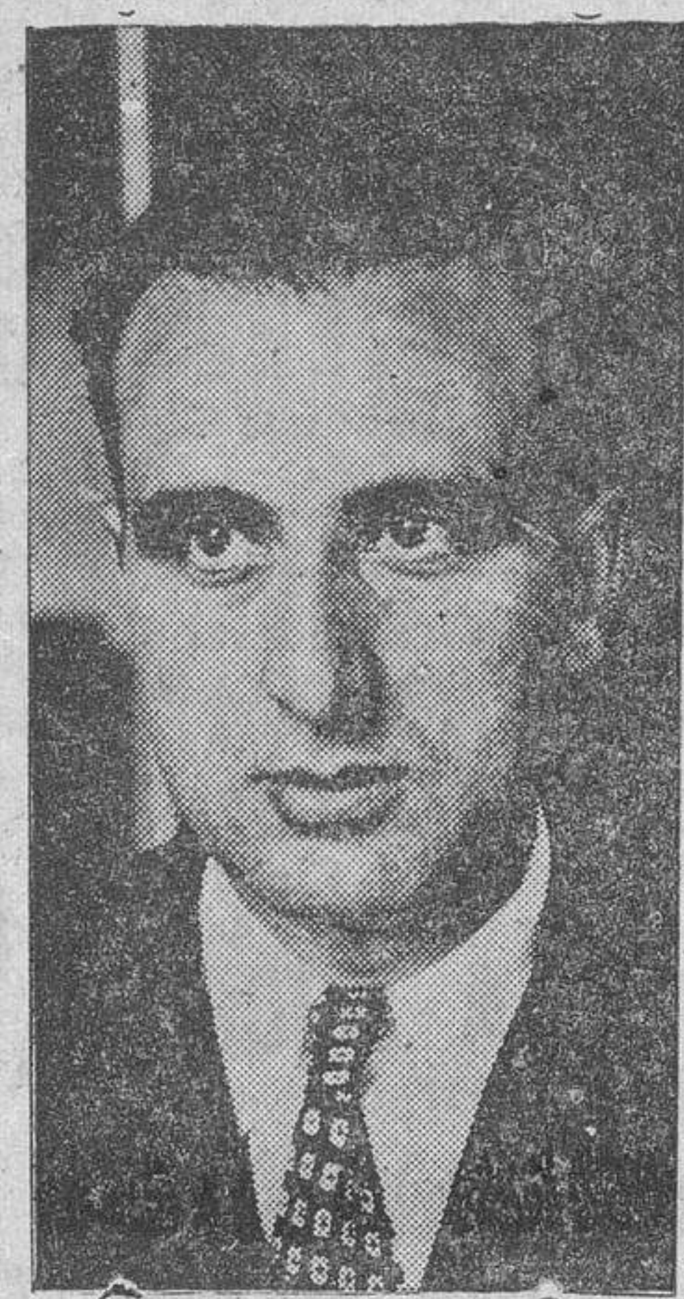
Don Joaquín Ruiz Jiménez y Cortés, que ha sido nombrado director del Instituto de Cultura Hispánica.