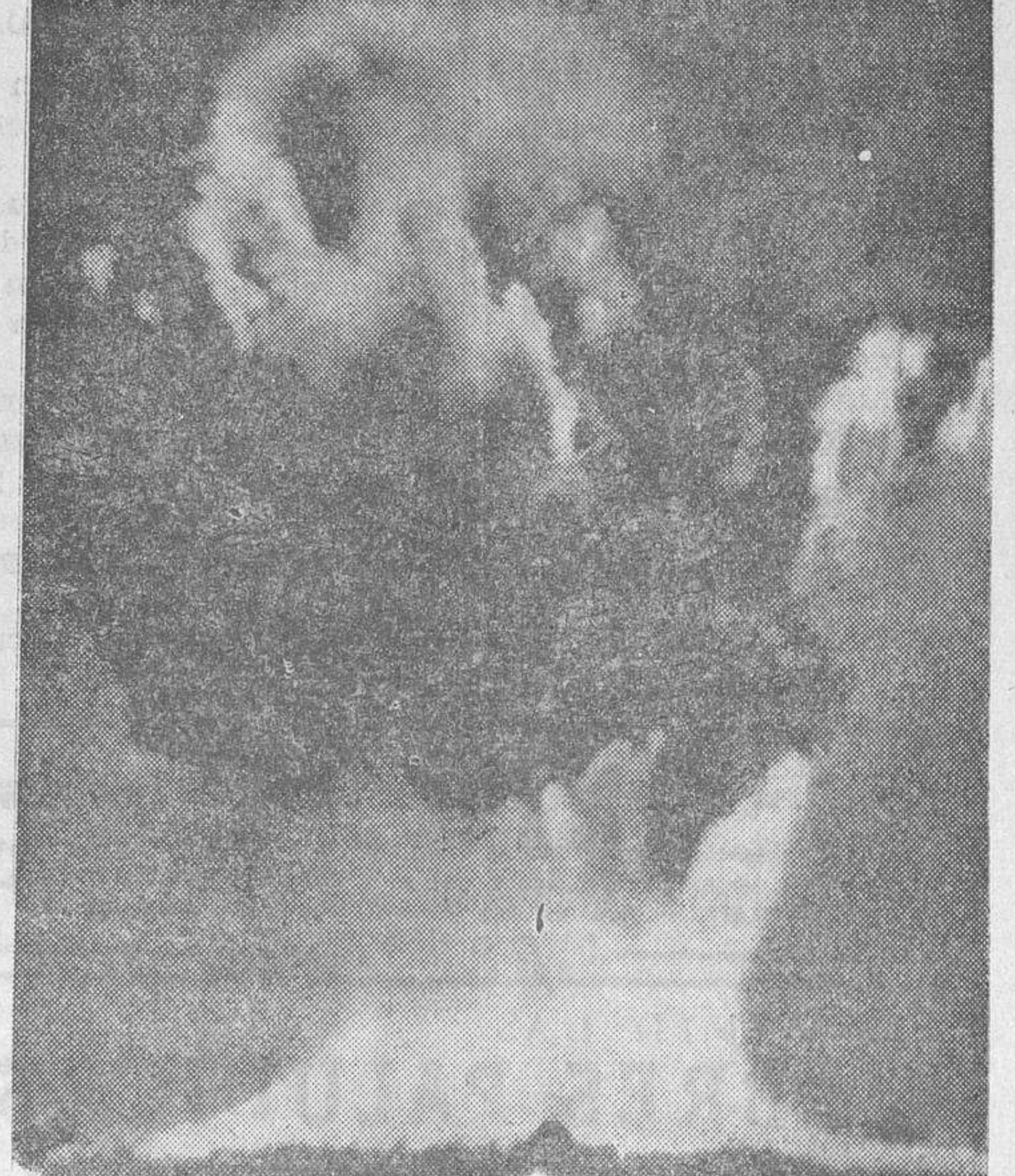
Fotografía obtenida a larga distancia, del instante de producirse la explosión de la bomba atómica submarina en el atolón de Bikini, prueba últimamente realizada