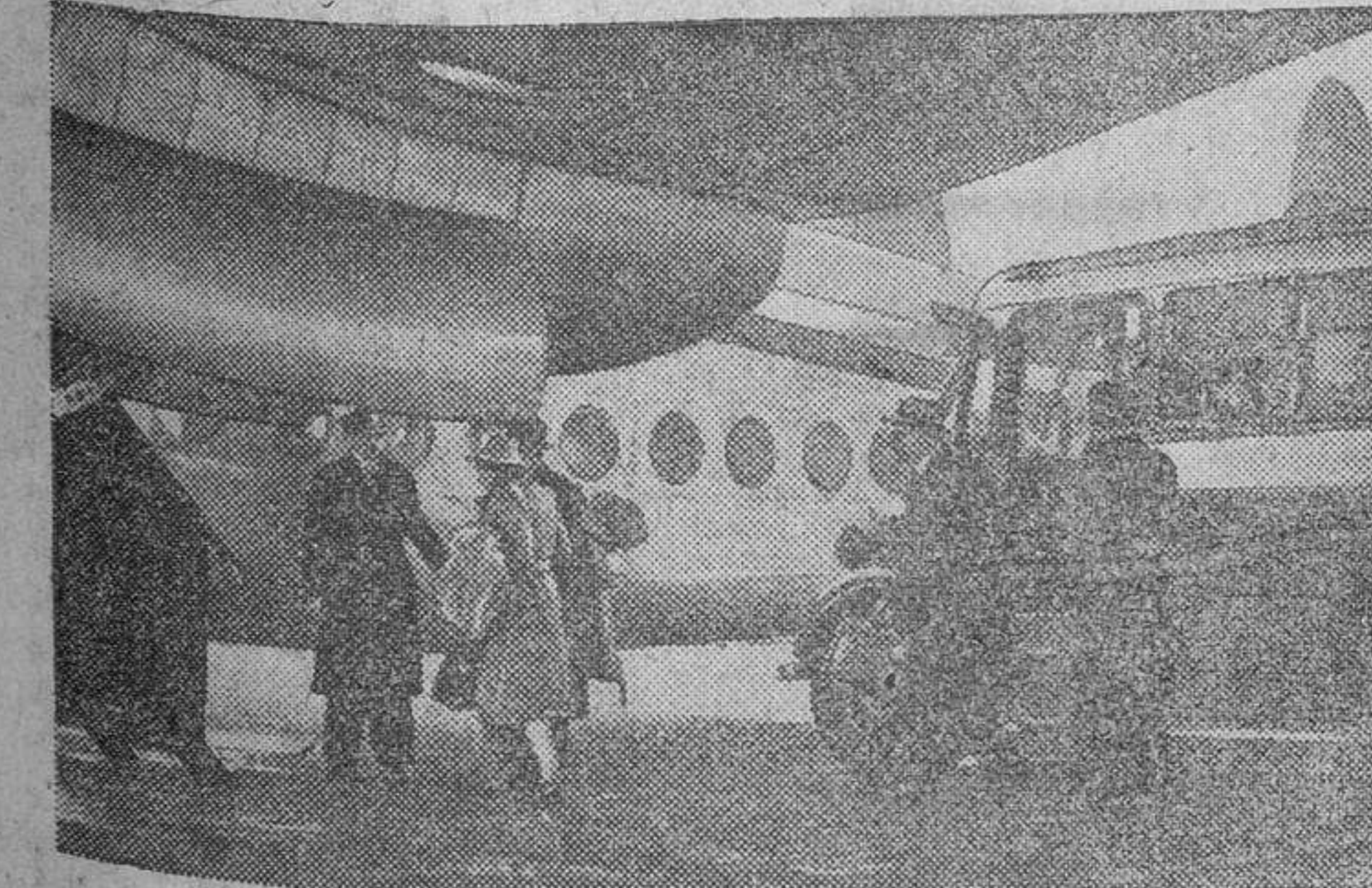
El Servicio Aéreo entre Inglaterra y África del Sur, es el primero que fue establecido a larga distancia desde que terminó la guerra. Dos aviones «Avro York» salen dos veces a la semana de Inglaterra, haciendo una recorrida de 10.000 kilómetros, llevando doce pasajeros cada uno y tardando en el viaje tres días. Hacen escala en Malta, pasan la noche en El Cairo, luego hacen otra corta parada en Khartoum y pasan la última noche en Nairobi. En esta fotografía vemos los pasajeros subiendo a bordo del avión, en el aeródromo de Londres.