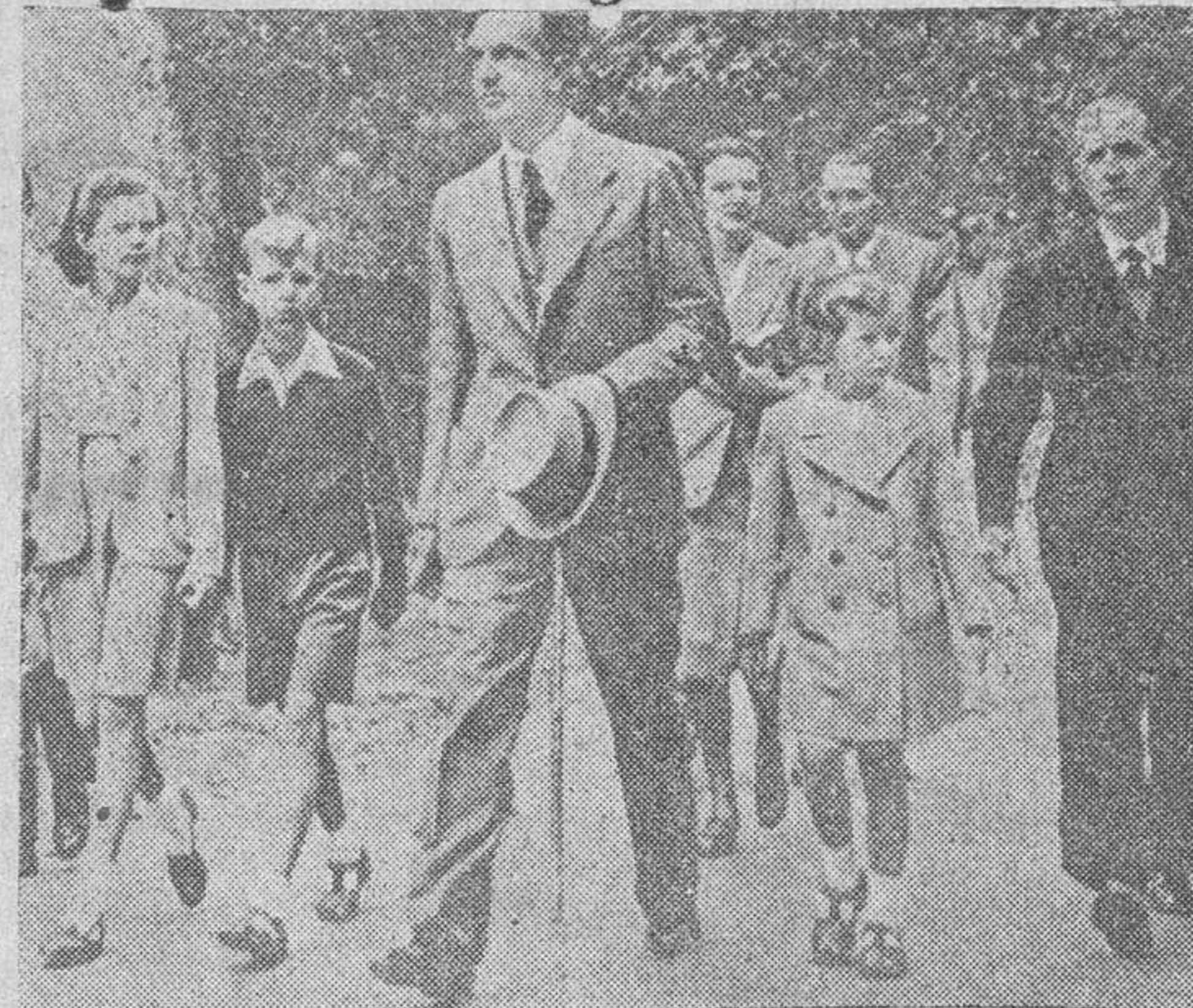
El ex rey de Italia, paseando con sus hijos y personas de su séquito, por los jardines de su residencia en Cintra