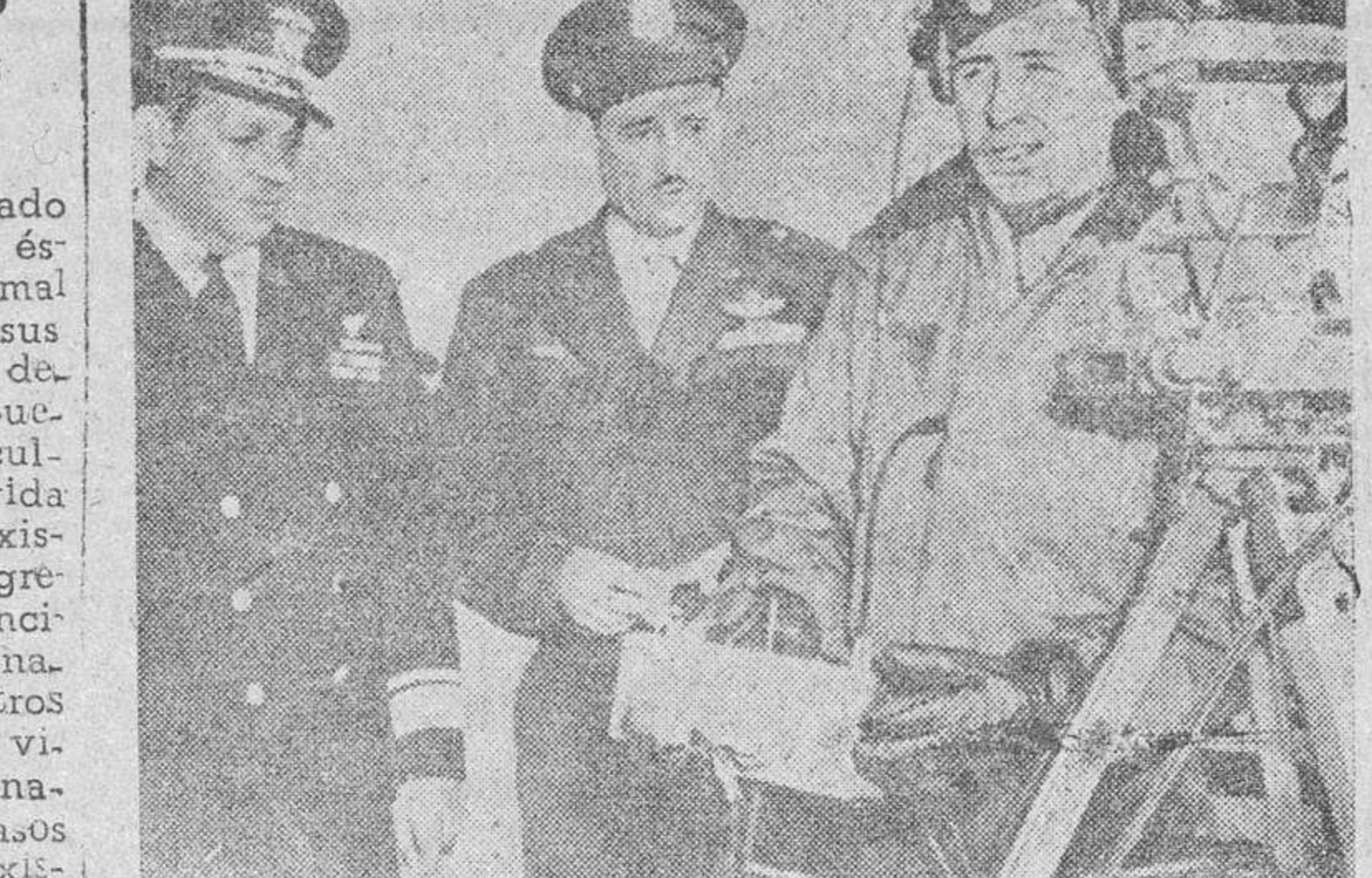
Oficiales norteamericanos encargados de la dirección y observación de las explosiones de las bombas atómicas, en Bikini, durante la preparación de los aparatos que registraron los efectos.

Fundado en 1893 Martes, 30 de julio de 1946 Suscripción: 10 pesetas al mes