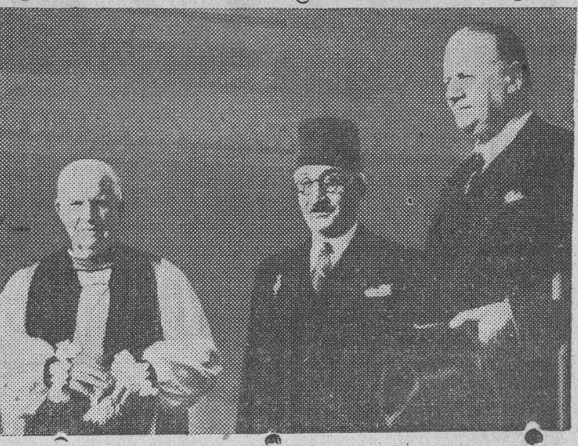
El rey Faruk de Egipto, ha hecho un donativo a la Catedral de su país, que consiste en sustituir la verja de madera que la rodeaba, por otra fabricada de plata y bronce. Fotografía obtenida después de la ceremonia, a la que asistió el embajador británico, lord Kilbarn (derecha), acompañado del Gran Chamberlán y por el obispo Gwyne.