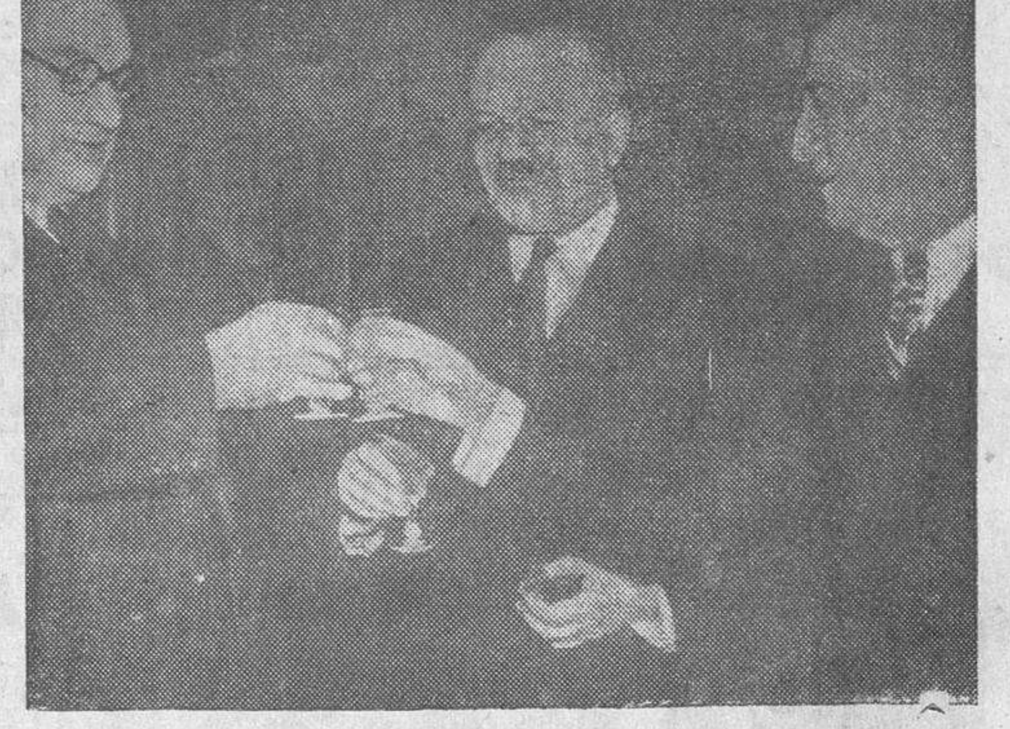
Los ministros de Asuntos Exteriores de Gran Bretaña (Mr. Bevin), Rusia (Molotov), y Estados Unidos (Mr. James Byrnes), celebran el final de la Conferencia de Moscú, brindando por la paz del mundo