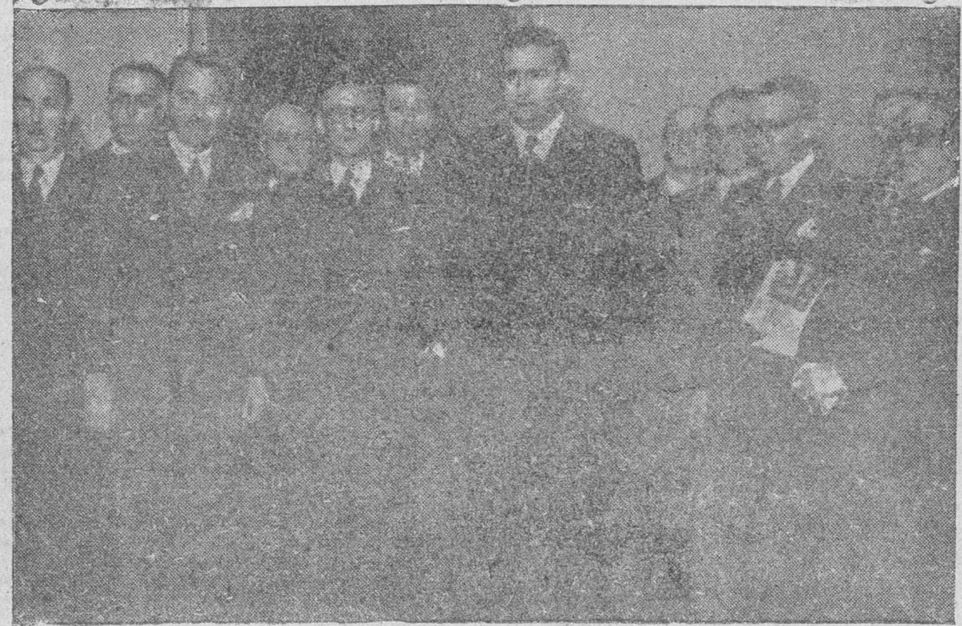
El ministro de Asuntos Exteriores, Sr. Martín Artajo, ha dado posesión, en el Palacio de Santa Cruz, al nuevo subsecretario, ministro plenipotenciario don Tomás Suñer. El acto se celebró dentro de la mayor cordialidad, y el señor Suñer fué felicitado por todo el personal del ministerio