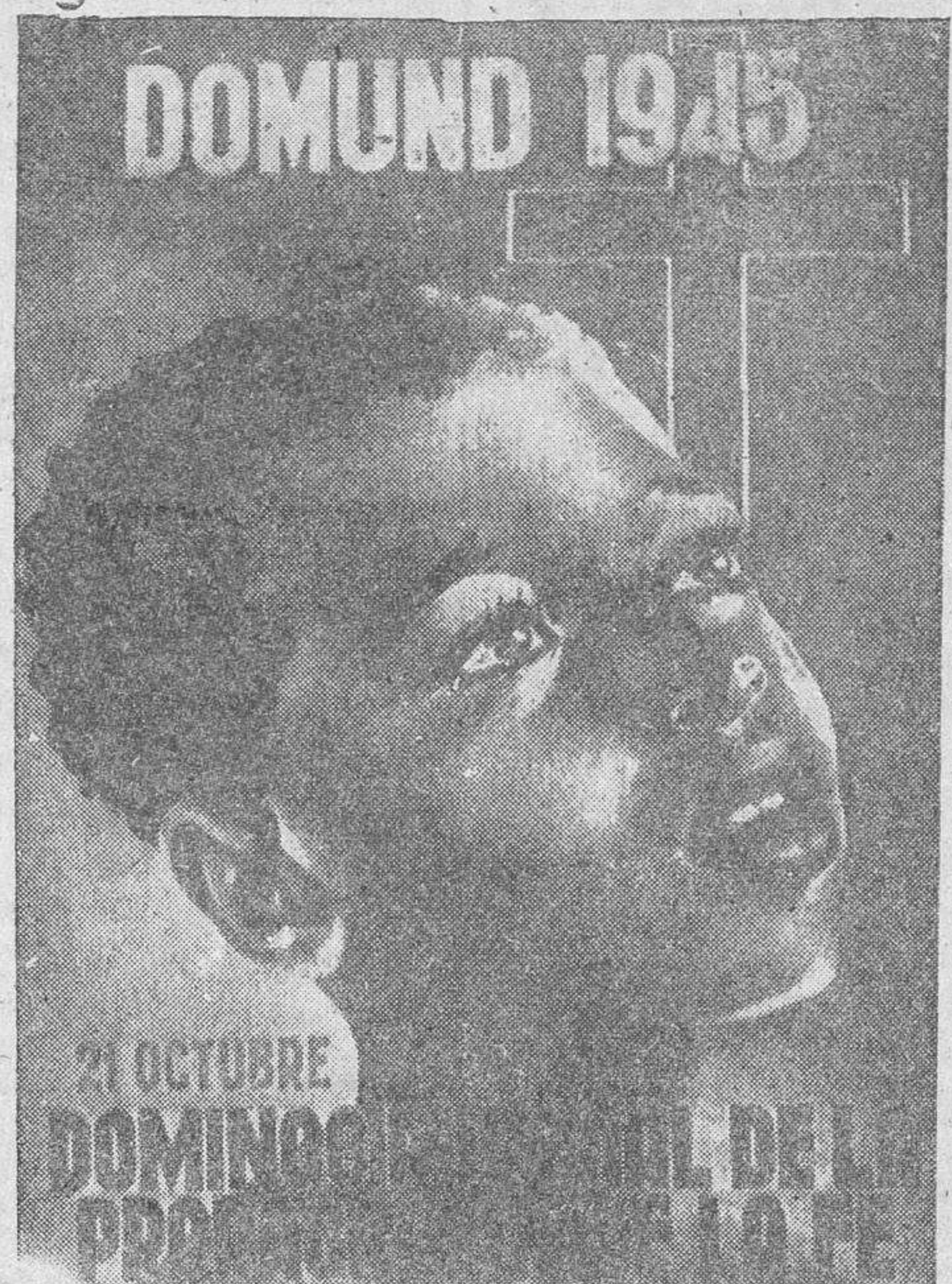
El día 21 del actual celebra el orbe católico el Domingo Mundial de la Propaganda de la Fé, conocido en España por el popular nombre de Domund. He aquí el cartel anunciador de la Jornada Misionera, obra del notable dibujante Julio Carrión