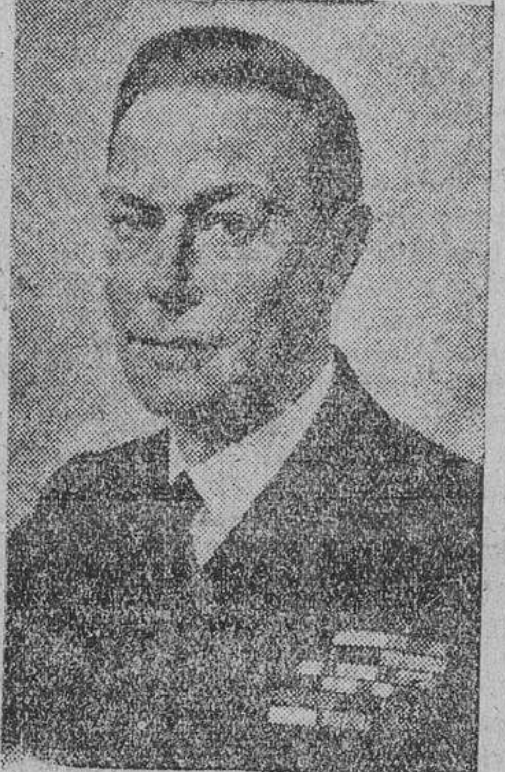
El rey Jorge VI de Inglaterra, en un momento de su discurso pronunciado en la apertura del Parlamento británico.

«El Gobierno ejercerá un control adecuado sobre la extensión de la propiedad pública, con objeto de que las industrias contribuyan al bienestar nacional». Anunció que se establecerá el mecanismo necesario para crear un plan efectivo de inversiones y dijo que el Gobierno someterá al Parlamento una Ley para colocar al Banco de Inglaterra en régimen de propiedad pública y