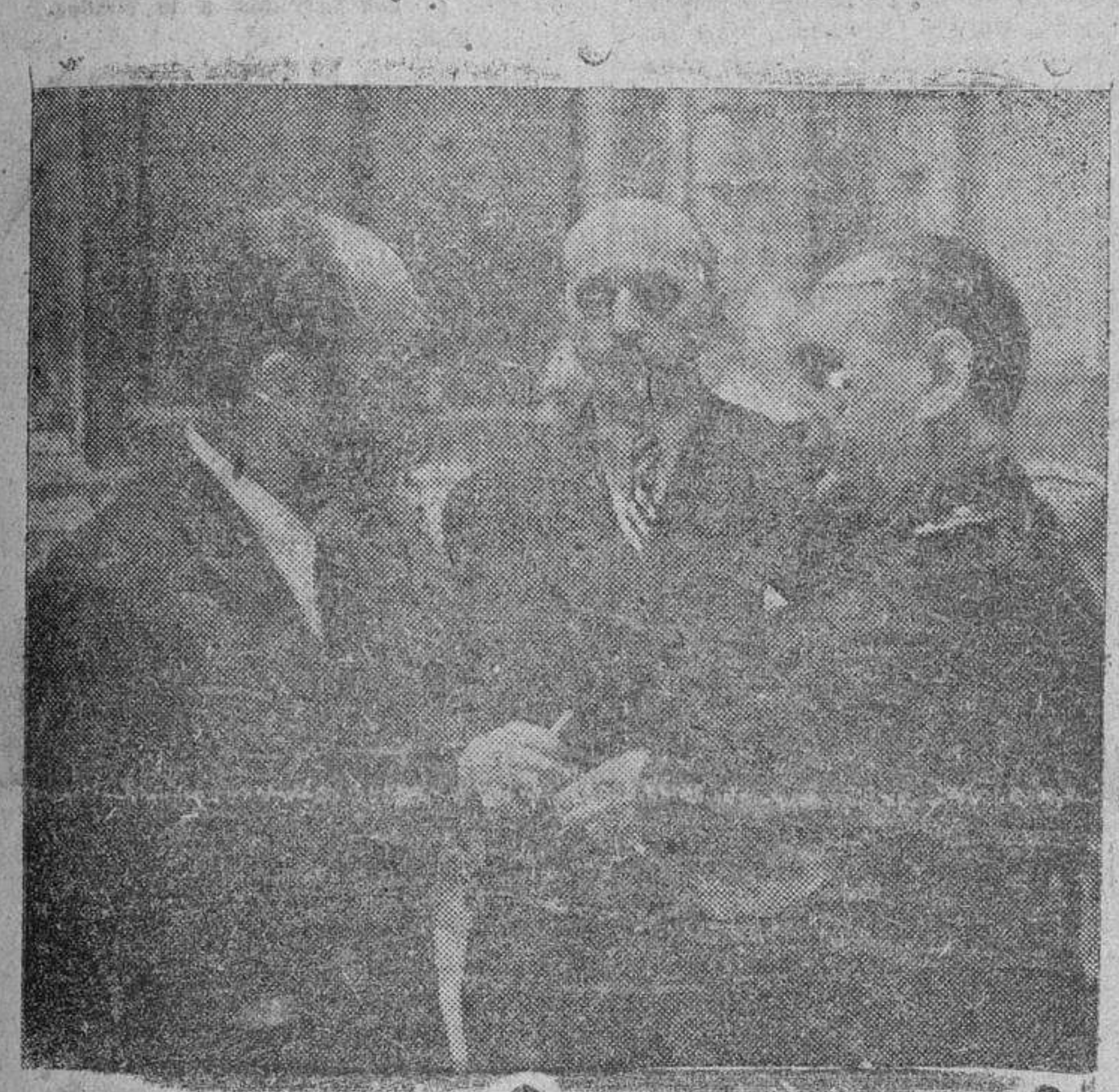
El Ministro Secretario General de Movimiento, camarada Arrese, conversando con el procurador en Cortes por los Municipios de la provincia de Salamanca, don Alipio Pérez Tabernero, poco antes de comenzar la sesión plenaria del lunes.