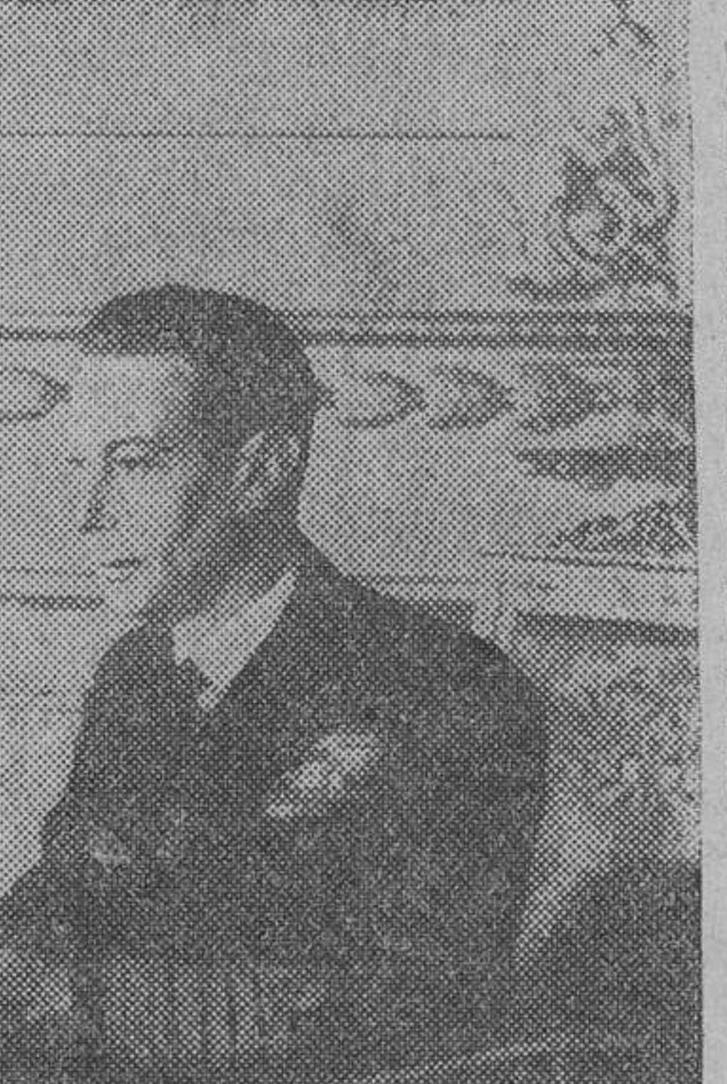
Winston Churchill, primer ministro británico...