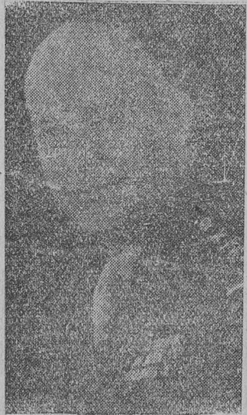
El general Eisenhower, jefe supremo de las fuerzas aliadas en el frente occidental...