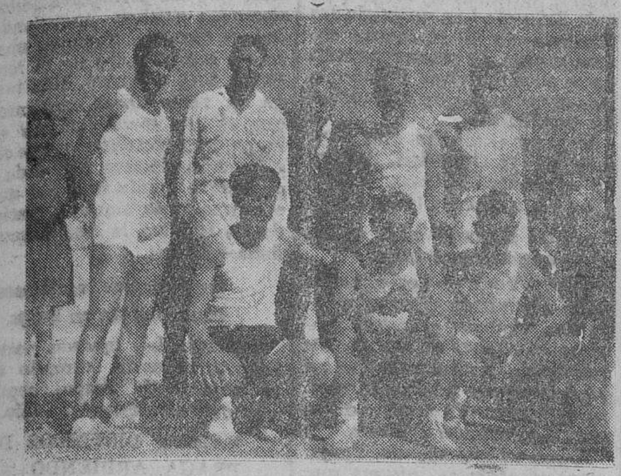
Equipo de la Casa Nuño, campeón del Torneo de baloncesto (Foto J. Núñez).

la categoría de los contendientes, que hicieron una magnífica exhibición. Mañana, jueves, a las doce de la mañana, en el campo del Helmiántico, el equipo campeón ofrecerá un encuentro de homenaje al equipo Monterrey. En el comienzo de este partido se entregará un banderín al capitán de éste con una inscripción alusiva a la deportividad de mostrada por el Monterrey durante este torneo.