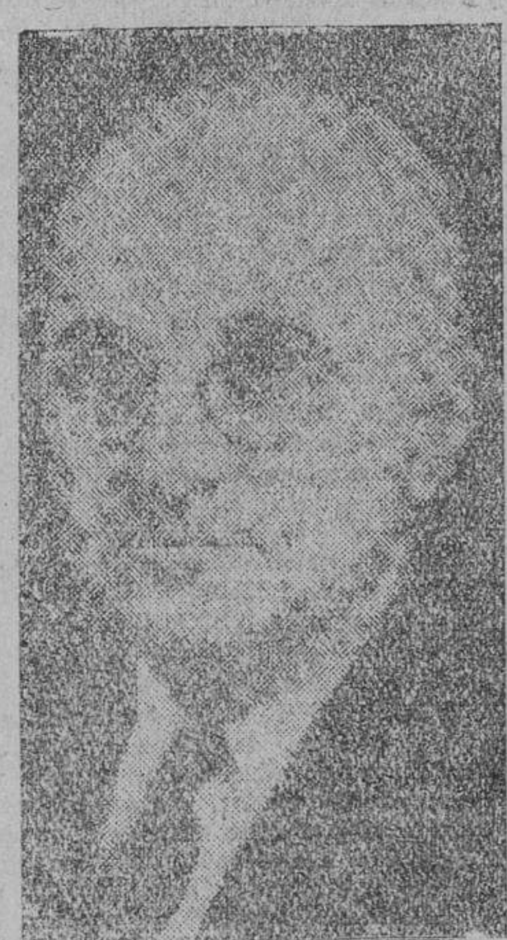
Harry S. Truman, presidente de los Estados Unidos...