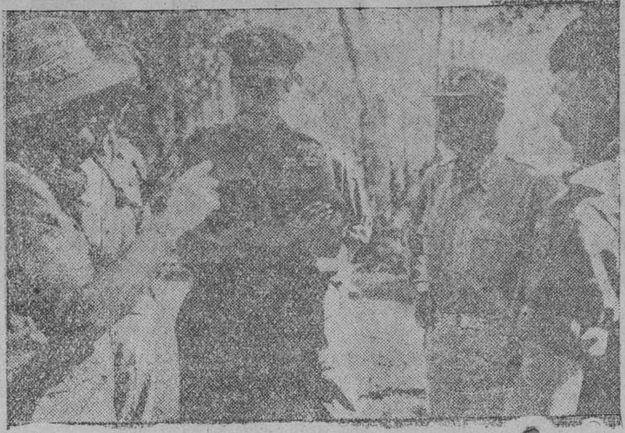
El jefe supremo de las fuerzas aliadas que combaten en Birmania, lord Mountbatten, conversa con los jefes de una división, durante una visita realizada al frente