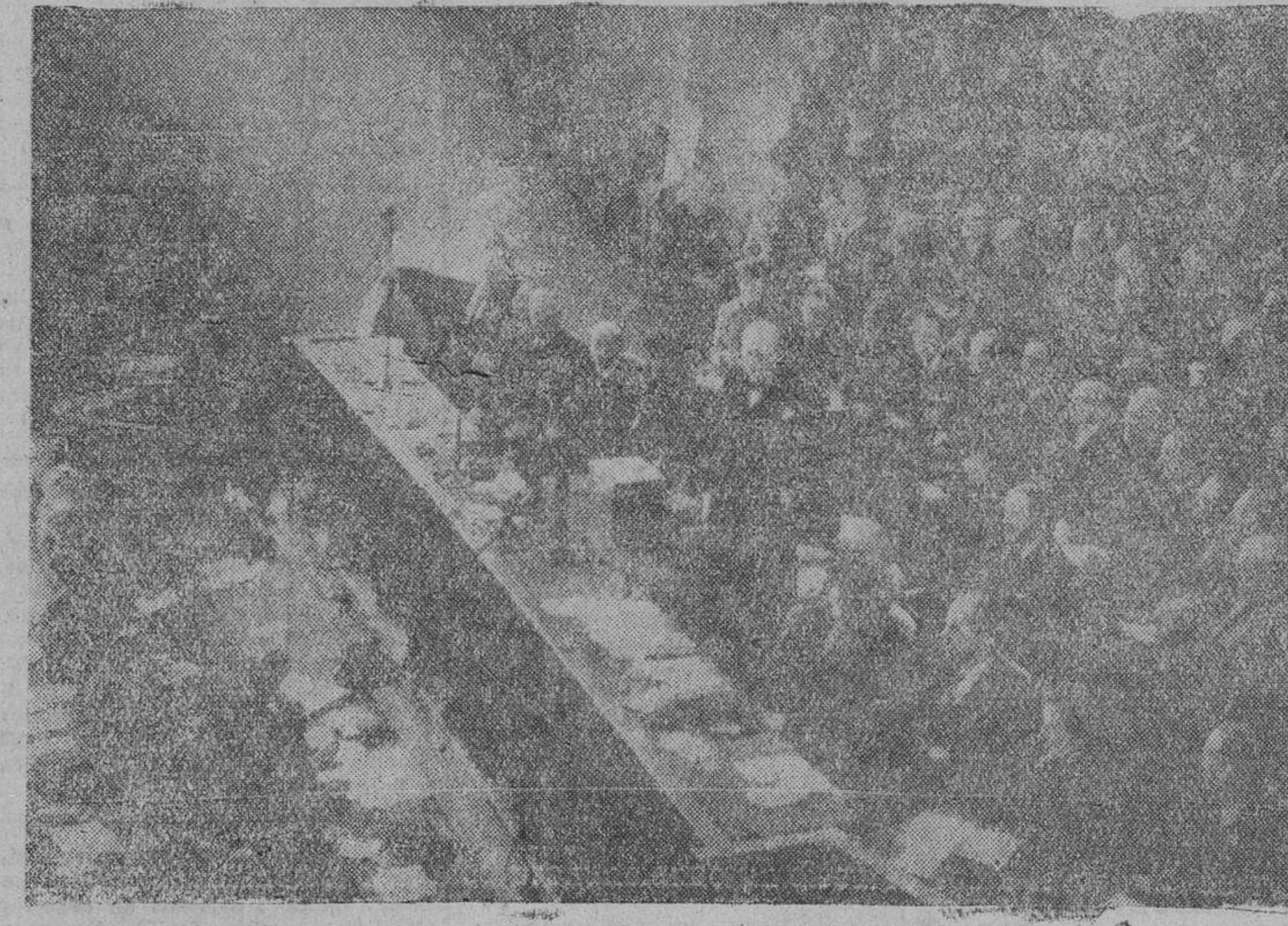
El primer ministro británico pronunciando un discurso sobre la política de guerra ante una reunión plenaria del Partido Conservador inglés