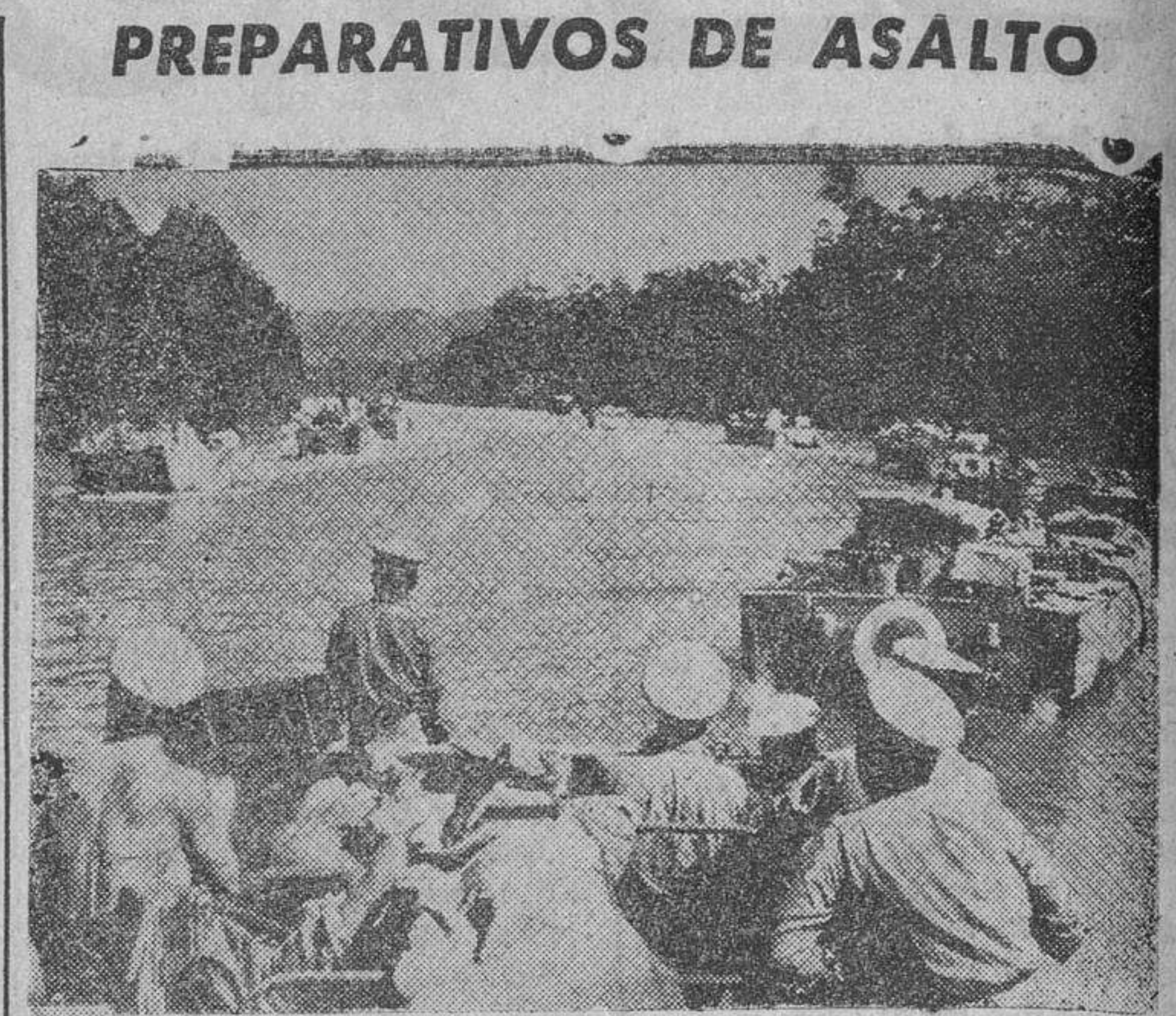
En el lugar designado de antemano por el alto mando aliado, se concentran las lanchas rápidas, que inmediatamente desembarcarán en territorio adversario.

Importante incendio en los muelles del puerto de Cádiz. El crucero «Canarias» y otros buques hubieron de desatraca para evitarse la propagación de las llamas.