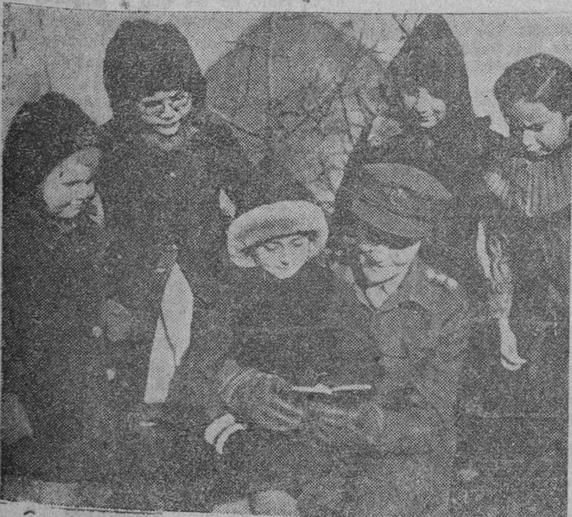
Mary Churchill, hija del «premier» británico, pasa sus ratos de descanso en el servicio, que presta en Bélgica, rodeándose de niños.