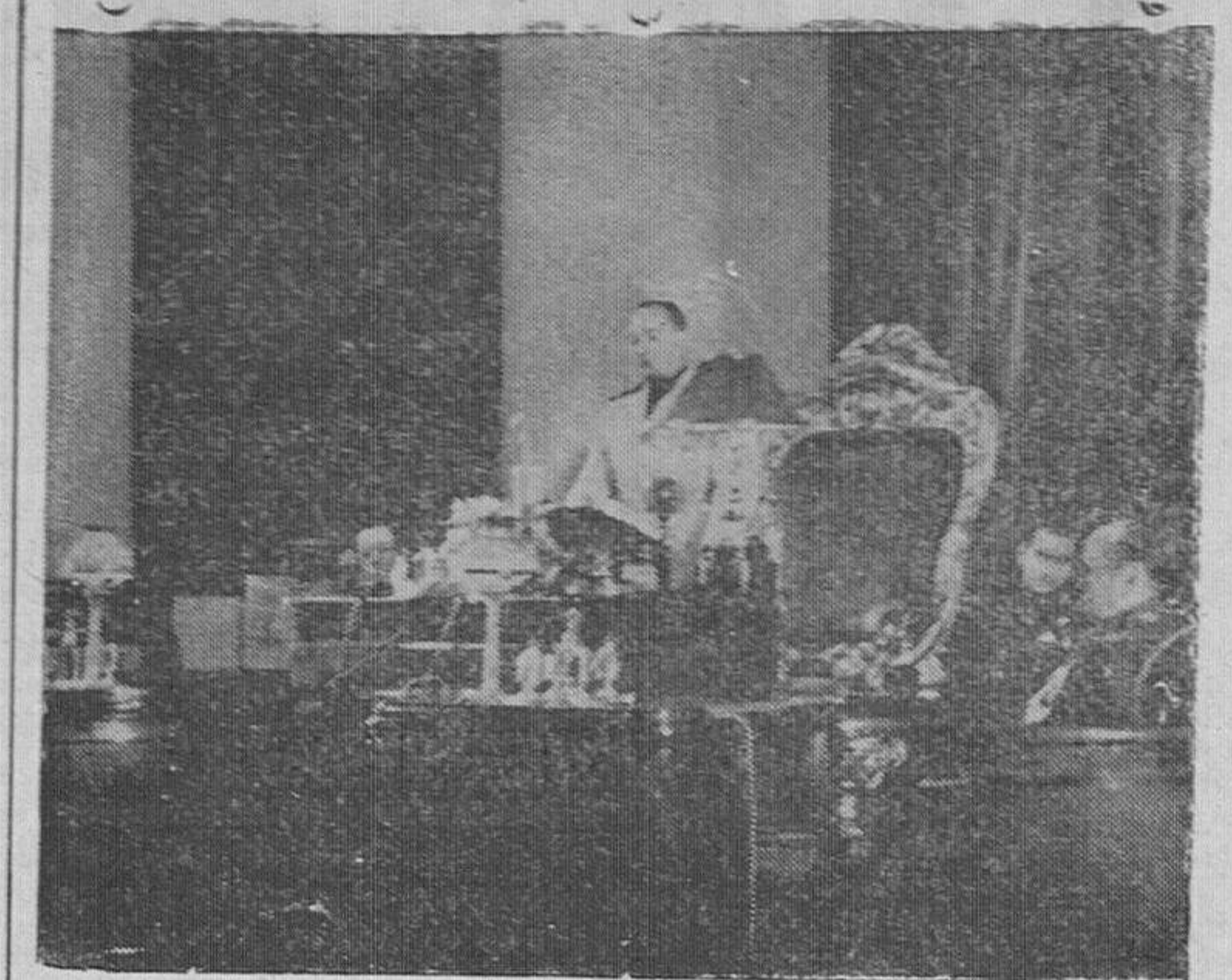
El ministro secretario general del Movimiento, pronunciando el discurso inaugural del III Consejo Sindical Industrial