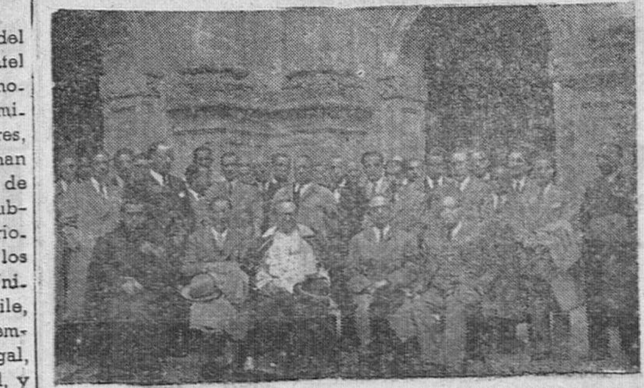
Asistentes a los actos celebrados el domingo, bajo la presiden-cia del excelentísimo señor Obispo, con motivo de la anual-tad de la Hermandad de San Cosme, San Damián y Santa Apolonia, de los que damos cuenta en otro lugar de este número.