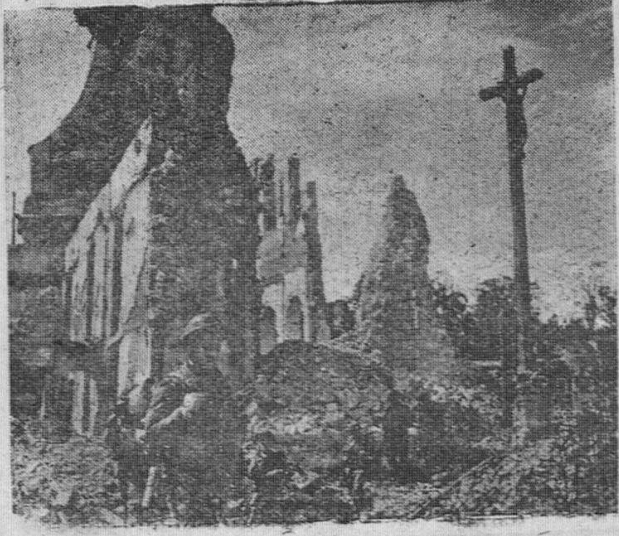
Ruinas de lo que fue ciudad de Linjeux, en cuyos alrededores se registraron violentos combates, a la entrada de las tropas aliadas.