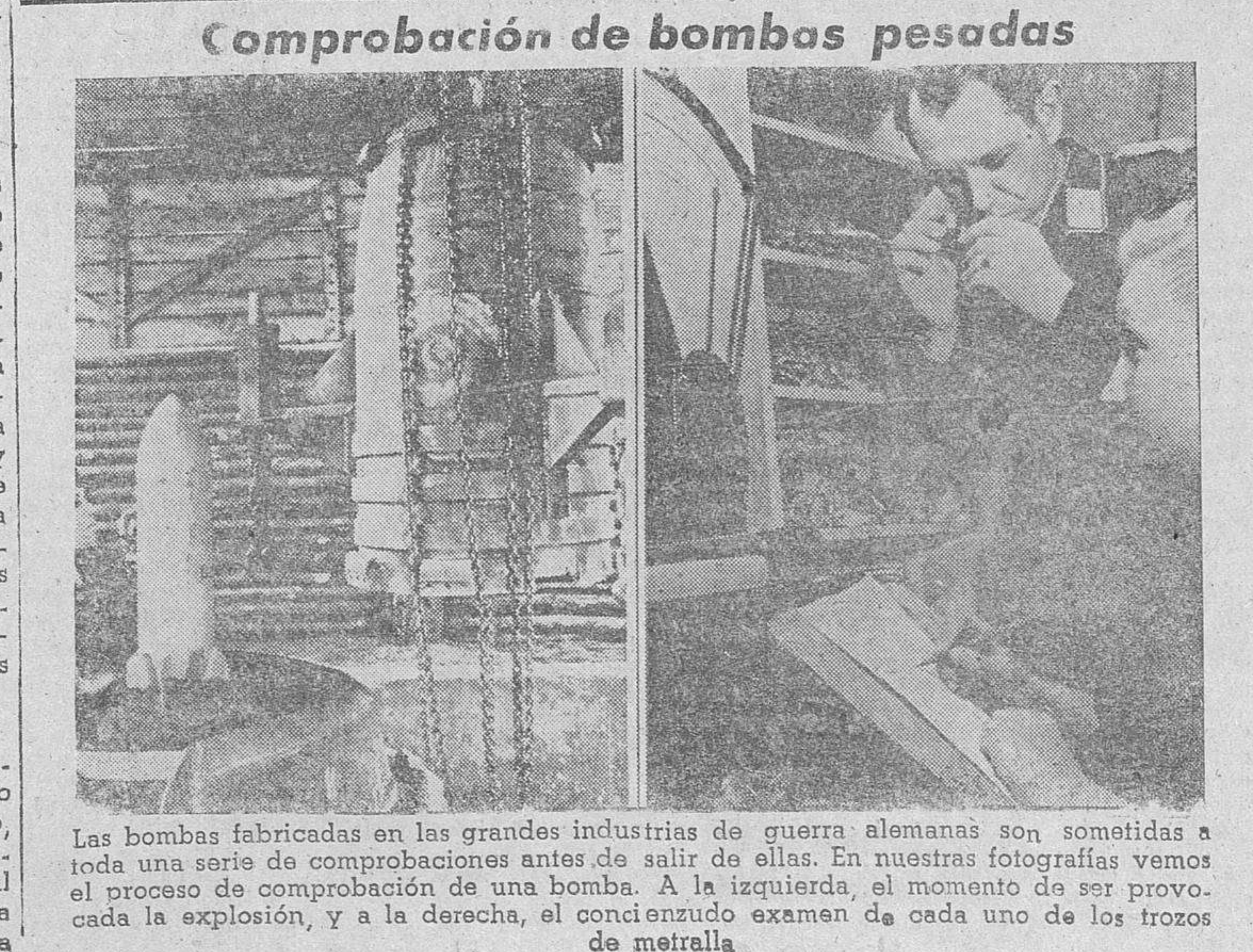
Las bombas fabricadas en las grandes industrias de guerra alemanas son sometidas a toda una serie de comprobaciones antes de salir de ellas. En nuestras fotografías vemos el proceso de comprobación de una bomba. A la izquierda, el momento de ser provocada la explosión, y a la derecha, el concienzudo examen de cada uno de los trozos de metralla